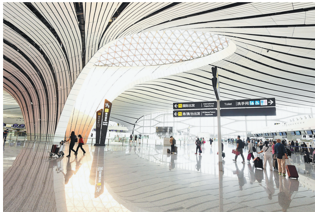
这是2020年9月22日拍摄的北京大兴国际机场内景。

2021年底，北京市支持雄安新区幼儿园项目实现竣工验收并正式移交雄安新区。北京援建的北海幼儿园、史家小学、北京四中、宣武医院三校一院