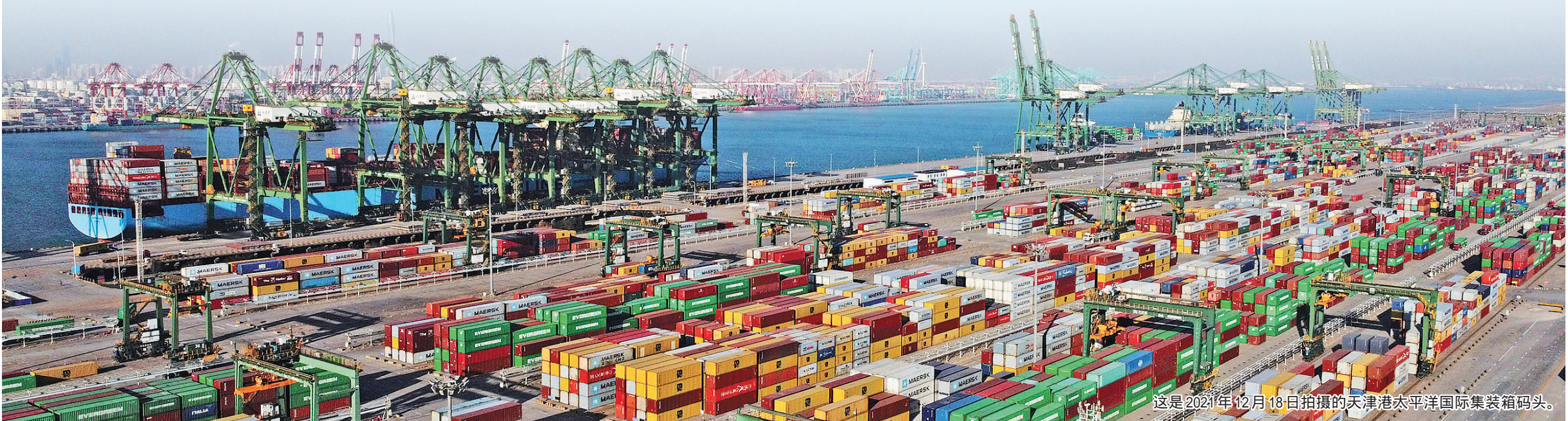
这是2021年12月18日拍摄的天津港太平洋国际集装箱码头。