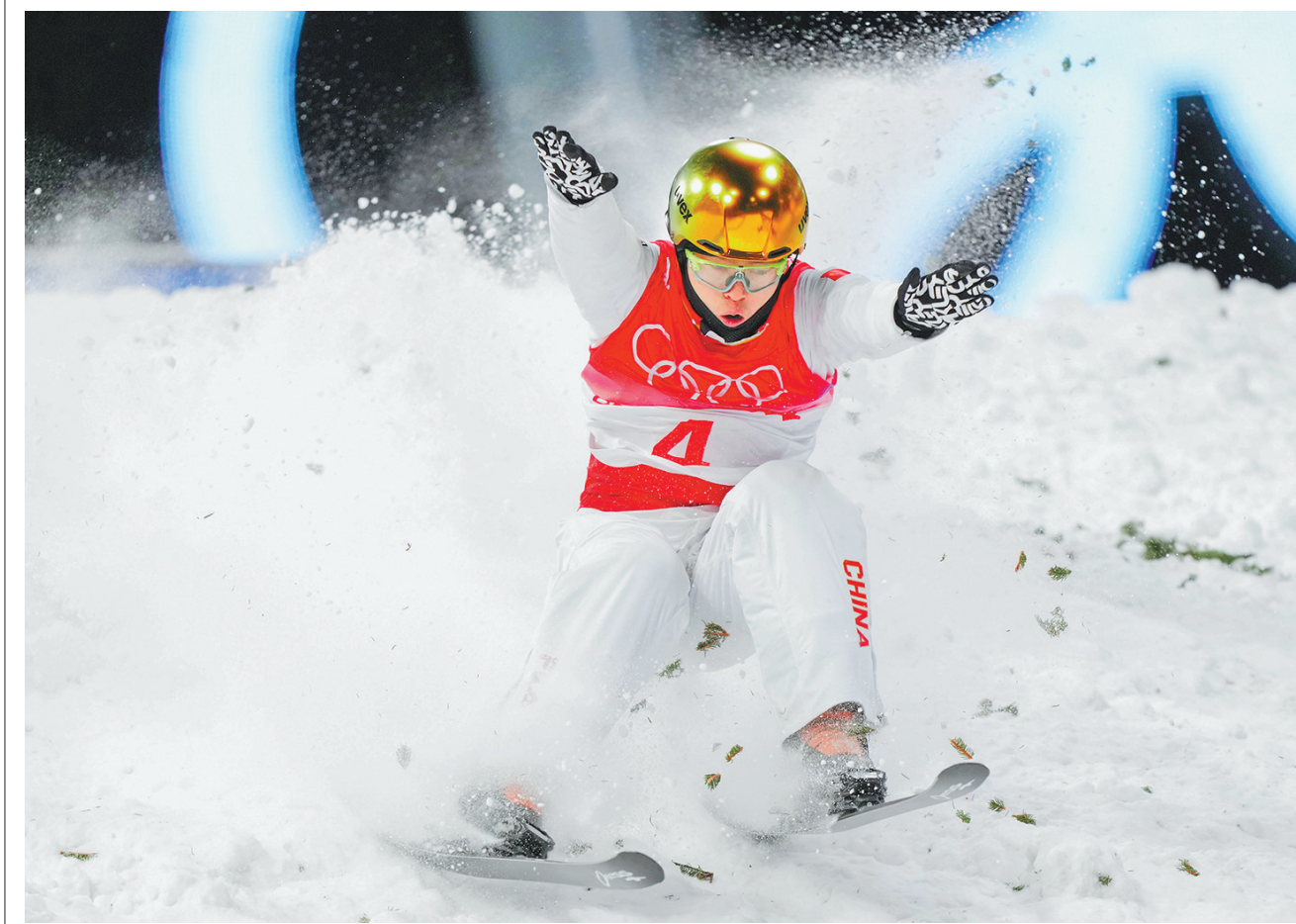
2月16日,中国选手齐广璞在比赛中。当日,北京2022年冬奥会自由式滑雪男子空中技巧决赛在张家口赛区举行。中国选手齐广璞夺得冠军。