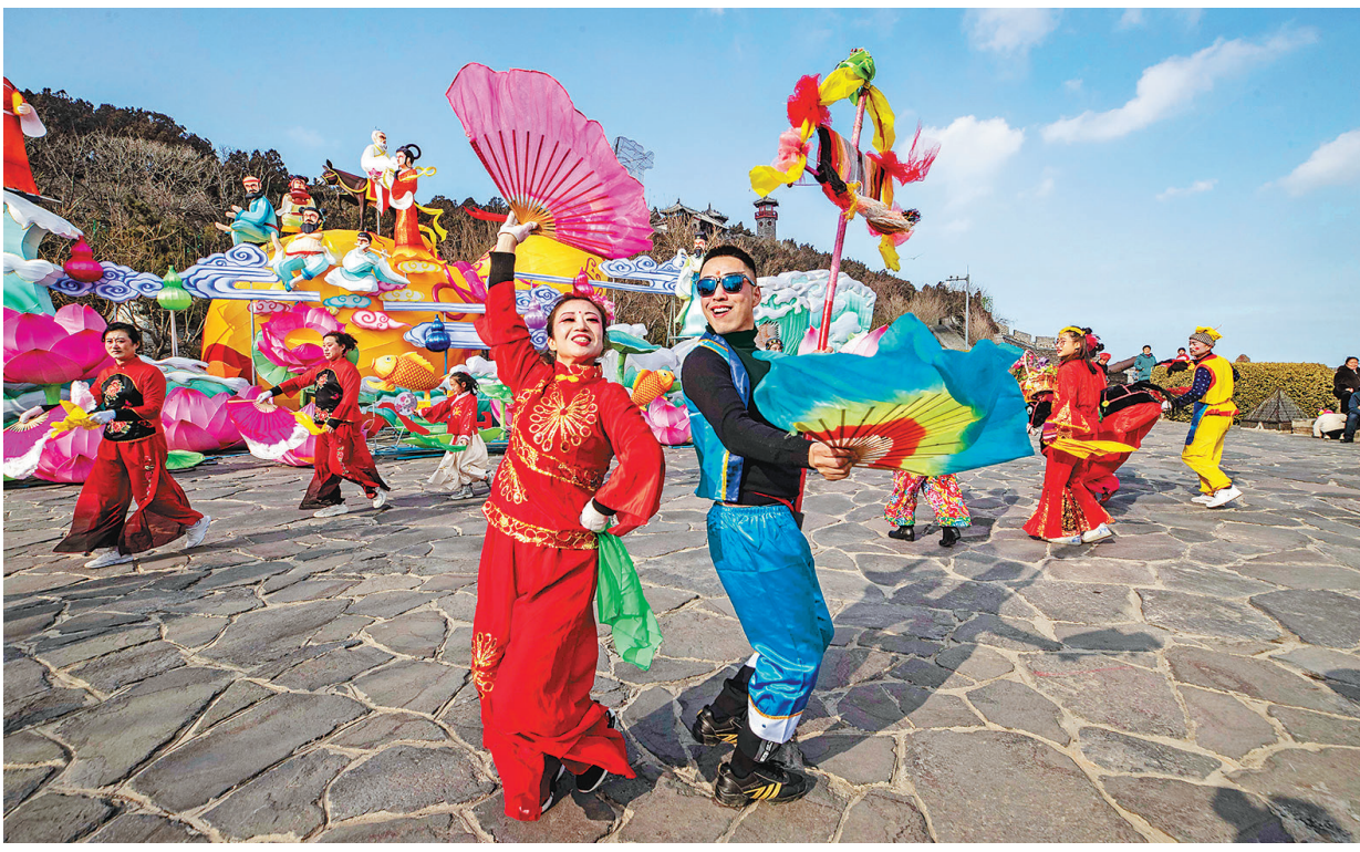
▲1月29日,山东省烟台市蓬莱阁风景区民间艺人在表演秧歌。

新华社北京1月29日电(记者董瑞丰 李恒)针对低风险地区返乡群众被强制劝返和集中隔离等问题,国务院联防联控机制综合组29日对执行防疫政策明确提出五个不得,并在国家卫生健康委官网首页开设春节返乡路公众留言板。 目前,我国本土疫情呈现局部零星点状散发,但总体疫情保持平稳。国际上疫情持续高位流行,国内人员跨区域流动和聚集性活动增加,我国仍面临较大的外防输入、内防反弹的压力。 针对近期有群众反映遇到返乡受阻等问题,国家卫健委新闻发言人米锋表示,国务院联防联控机制综合组已进行核实,并及时反馈地方要求立即整改。对执行防疫政策再次提出明确要求,概括起来就是五个不得。 米锋介绍,五个不得,即不得随意禁止外地群众返乡过年,不得随意扩大限制出行范围,不得限制出行范围由中、高风险地区扩大到所在地市及全省,不得对低风险地区返乡群众采取强制劝返、集中隔离等措施,不得随意延长集中隔离观察和居家健康监测期限。 指导各地统筹做好春节期间疫情防控和群众返乡。疫情防控需要力度、需要速度,更需要温度和精度。国家卫生健康委疾控局一级巡视员贺青华表示。 此外,国务院联防联控机制综合组在国家卫生健康委官网首页开设春节返乡路公众留言板。群众在返乡途中遇到的层层加码等问题,可在留言板反映,相关部门将认真核实、督促整改。 为防止疫情防控简单化、一刀切,米锋表示,各地要加强应急值守、快速反应,既要科学精准落实防疫措施,又要对群众饱含温情,解决实际困难,让广大群众度过一个健康、欢乐、祥和的春节。