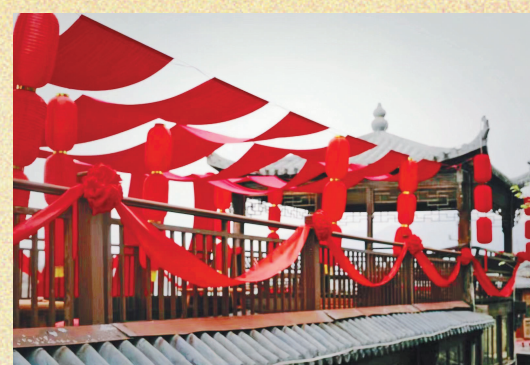
装饰一新的虎年观光船。