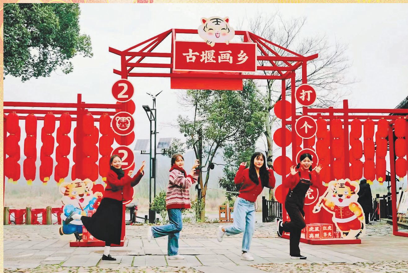
古堰画乡景区以虎为主题,扮上了新年的红妆。