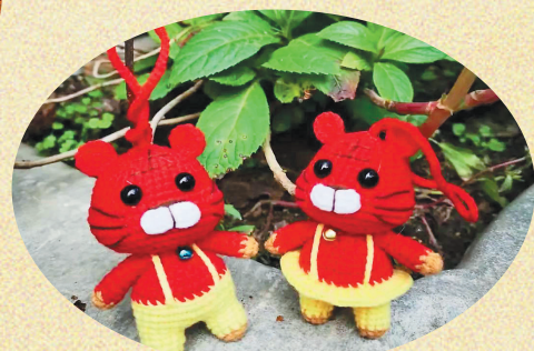
毛线情侣虎 钥匙扣。