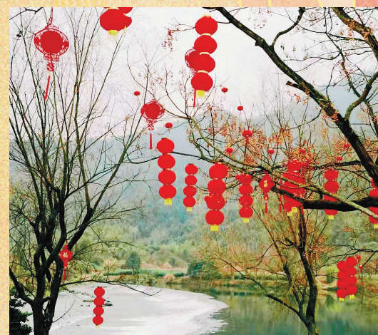
串串大红灯笼点缀画乡美景。