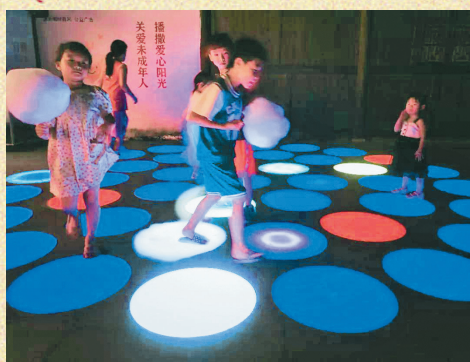
绚烂灯光秀正在上演。

一家歇的中草药健康虎,每一只都是纯手工缝制,这些小老虎的肚子里,装满了中草药(粉),据说是可祛湿除秽醒脑,同时还有驱蚊的作用。