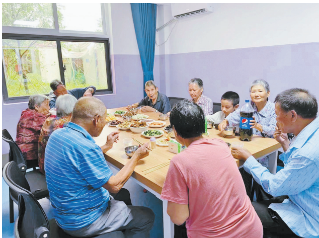
大坪幸福坊里的幸福午餐。