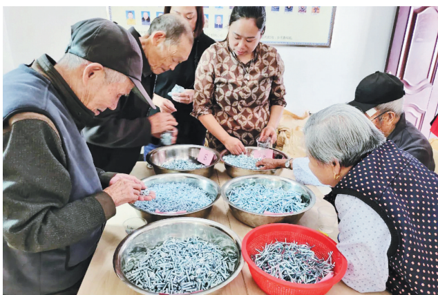
老人们在雾溪畲族乡幸福坊里从事来料加工。