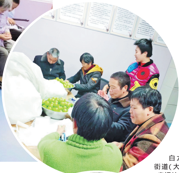
白龙山街道(大坪)幸福坊。