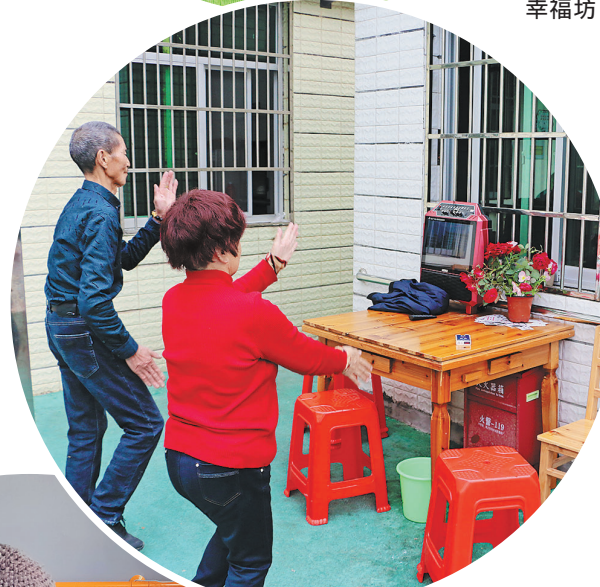
老人们在元和街道幸福坊里休闲娱乐。