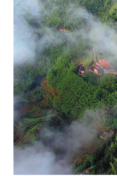
这是近日拍摄的松阳县竹源乡。近年来,竹源乡严控违建,狠抓大搬快聚,全力推动全域土地综合治理工作,扮靓古村落。

本报讯(记者 杨敏 见习记者 吴怡庆 通讯员 胡惠菲)爱心企业给我们缴纳浙丽保,感觉生活有保障,有医靠了,从心里感到高兴。近日,庆元竹口镇新窑社区便民服务服务中心里排起了长长的队伍,登记身份证、扫码支付,整个工作井然有序,当地一家企业出资为新窑村60岁以上老人参保浙丽保,收到这份暖心礼物后,老人们脸上洋溢着笑容,连连说着感谢。