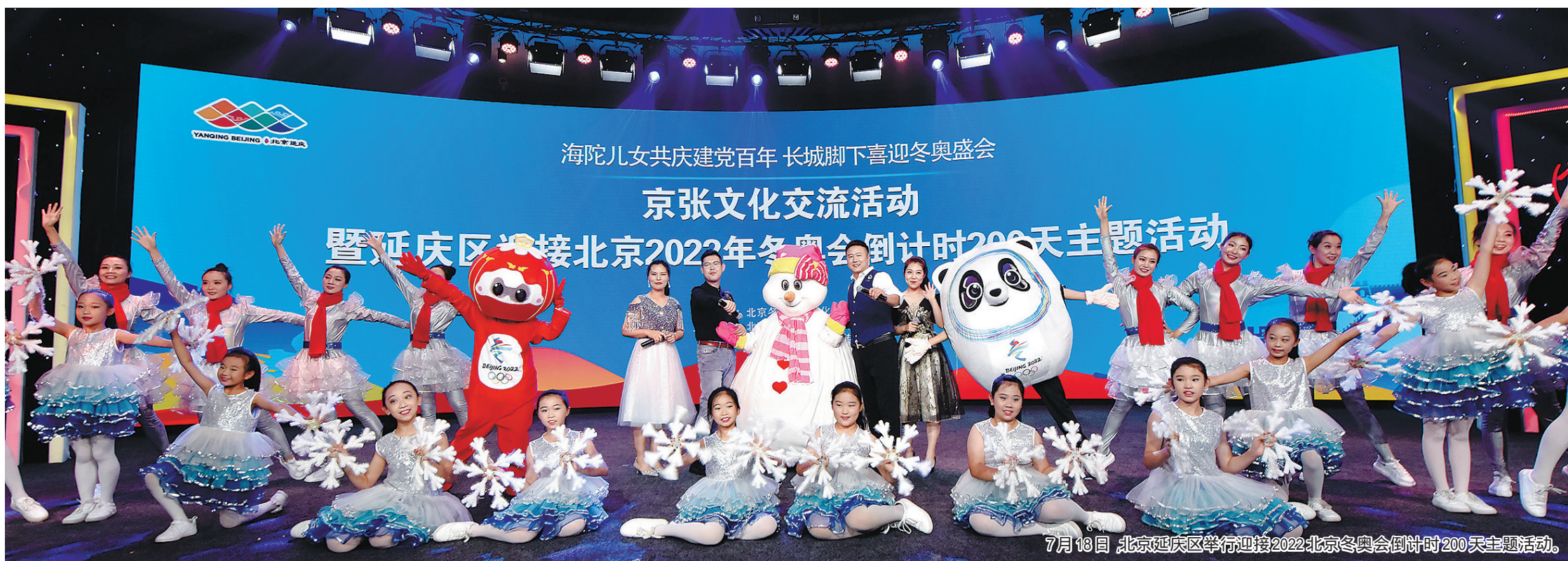
7月18日 北京延庆区举行迎接2022年北京冬奥会倒计时200天主题活动。