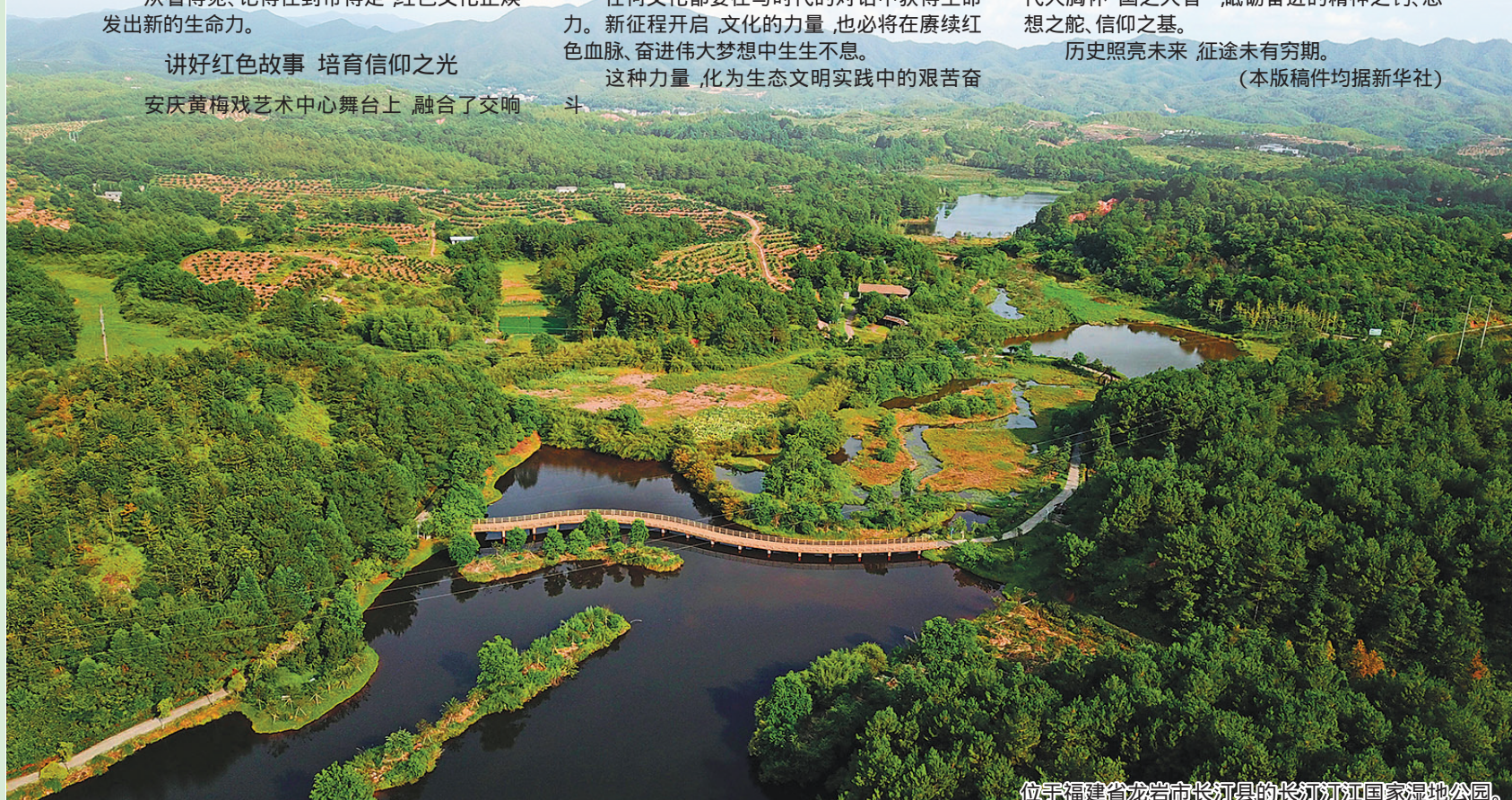
位于福建省龙岩市长汀县的长汀汀江国家湿地公园。