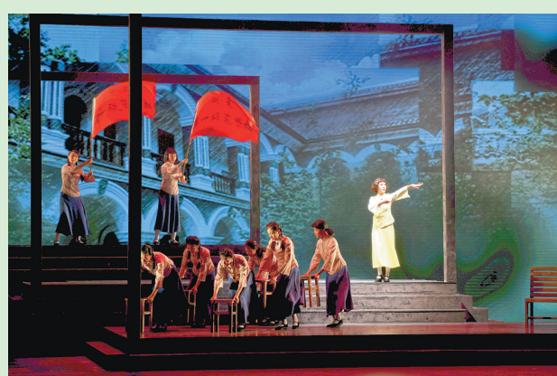
9月26日,在第九届中国(安庆)黄梅戏艺术节开幕式上,黄梅戏演员演出《不朽的骄傲》。