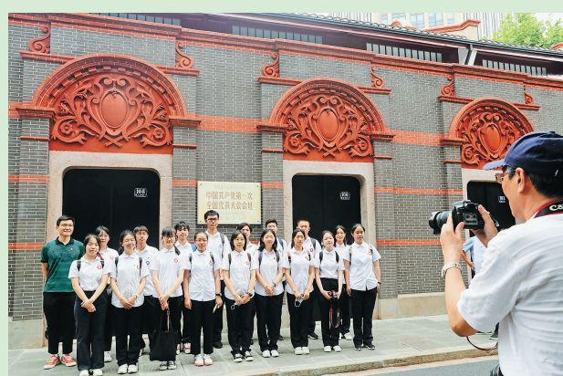
7月23日,人们在中共一大会址前留影。