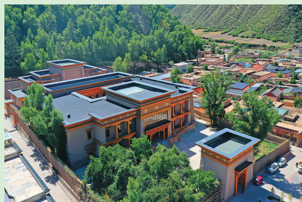
这是9月11日拍摄的甘肃省甘南藏族自治州卓尼县木耳镇博峪村村貌。