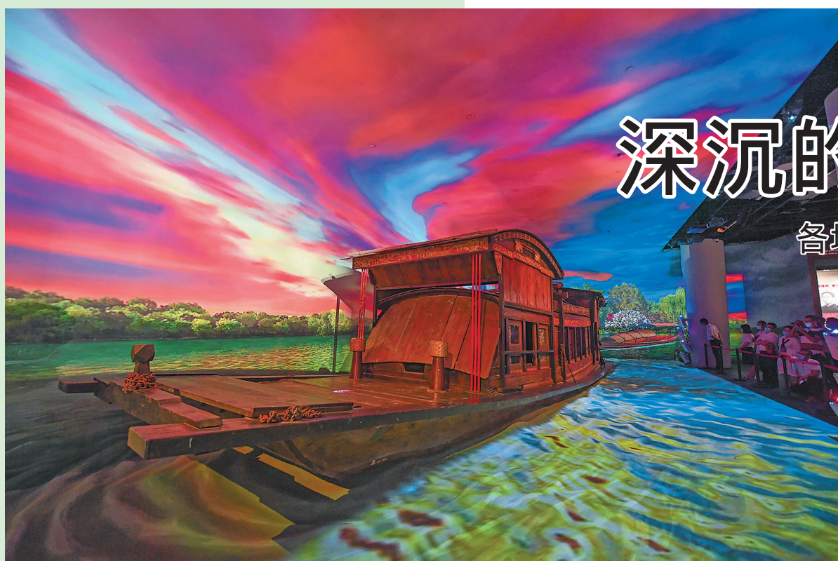
6月30日,在位于浙江嘉兴的南湖革命纪念馆内,参观者在观看红船模型及多媒体场景重现。