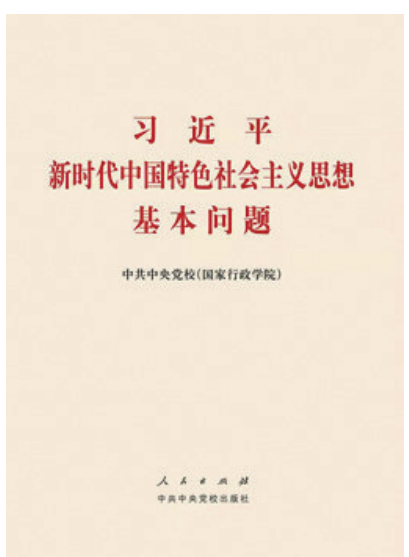
人民出版社 中共中央党校出版社