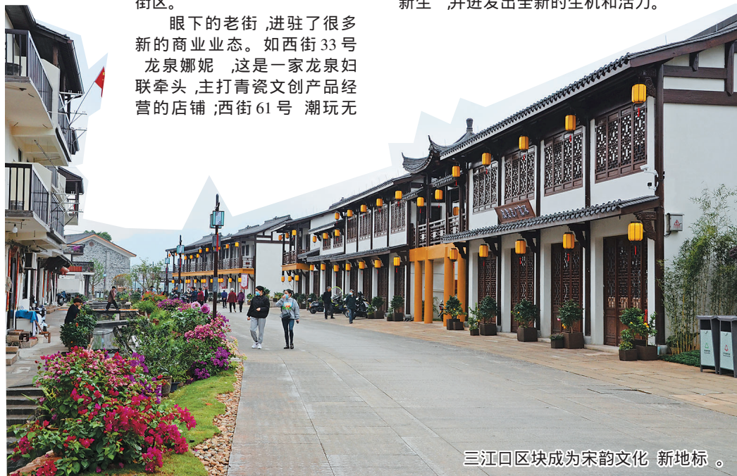
三江口区块成为宋韵文化“新地标”。