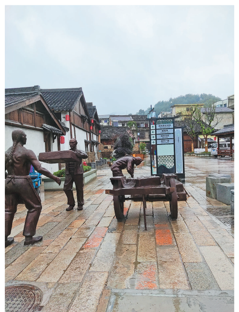
西街修缮或恢复了一些老建筑。