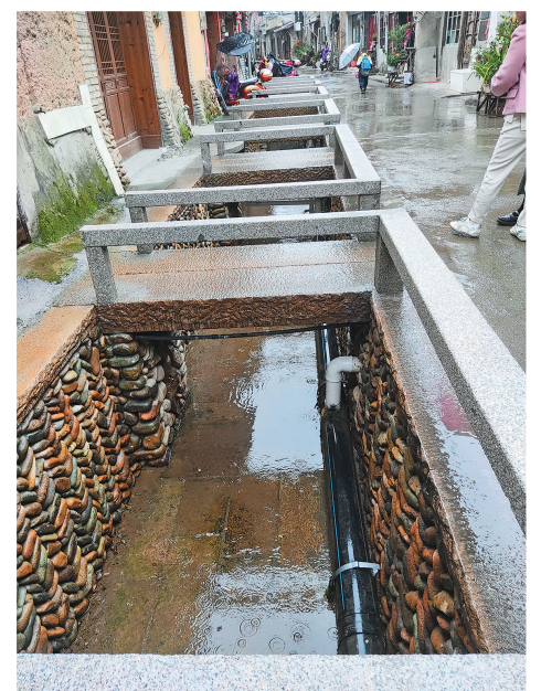
省文保云水渠露出了美丽的容颜。