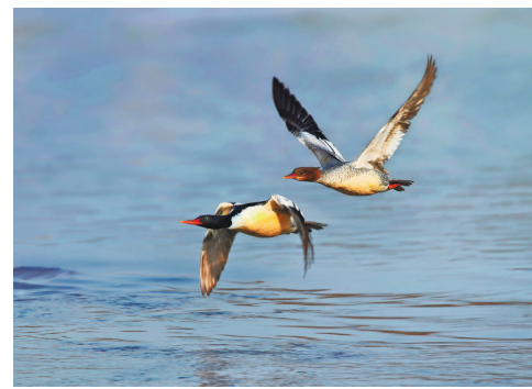
松阴溪上的中华秋沙鸭