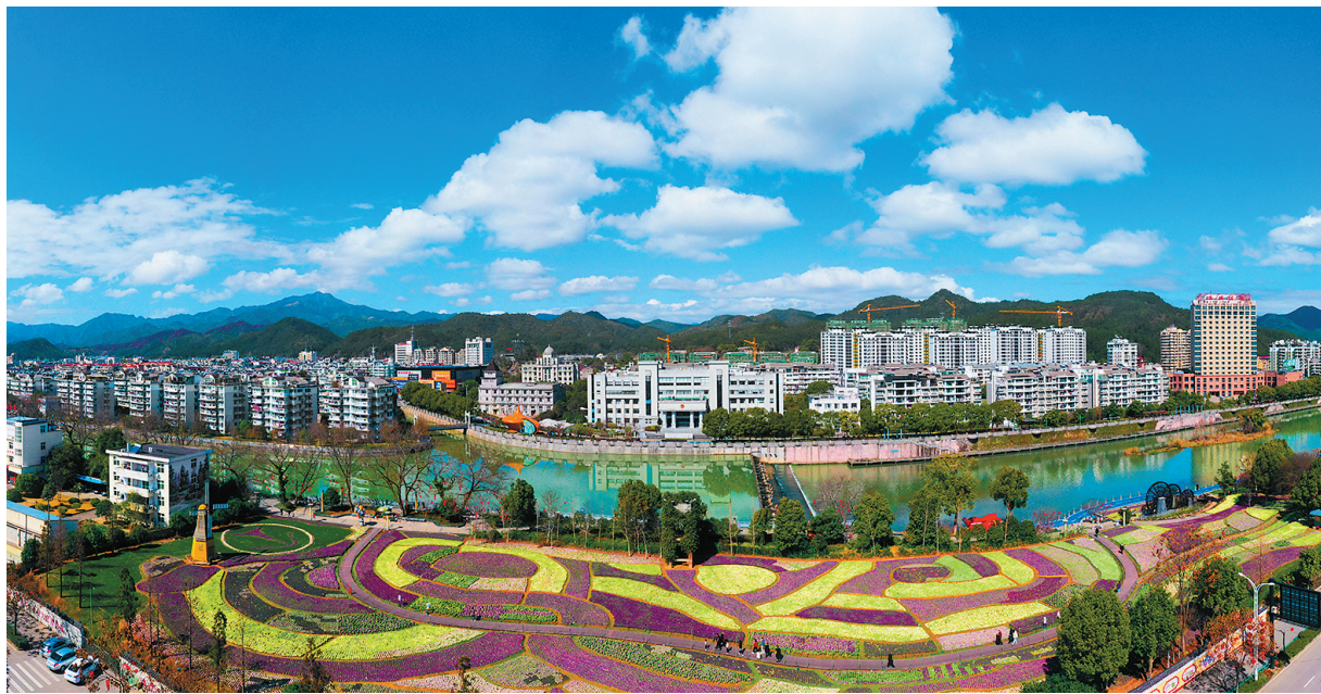
云和浮云溪畔四季花田成为县城的一道亮丽风景线。

工业总产值从不足10亿元增加到近200亿元,城镇化率从30.8%提升到73.1%,78%的农村劳动力从事二三产业,超过93%的学生在县城就读。这是一个山区小县20年来发生的巨变。