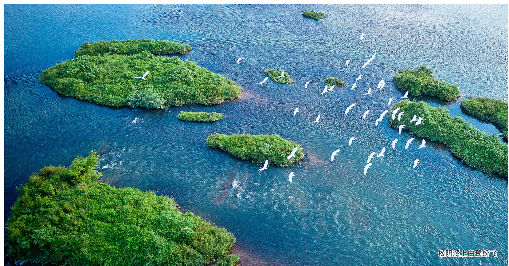
松阳溪上白鹭纷飞

两年来，论坛达成的重要共识、形成的重要经验，进一步在松阳取得重大成果。松阳何以能牵手“世界级权威组织”？第一届国际论坛以来，松阳取得了哪些新成绩、新经验？未来松阳的乡村奔向何方？