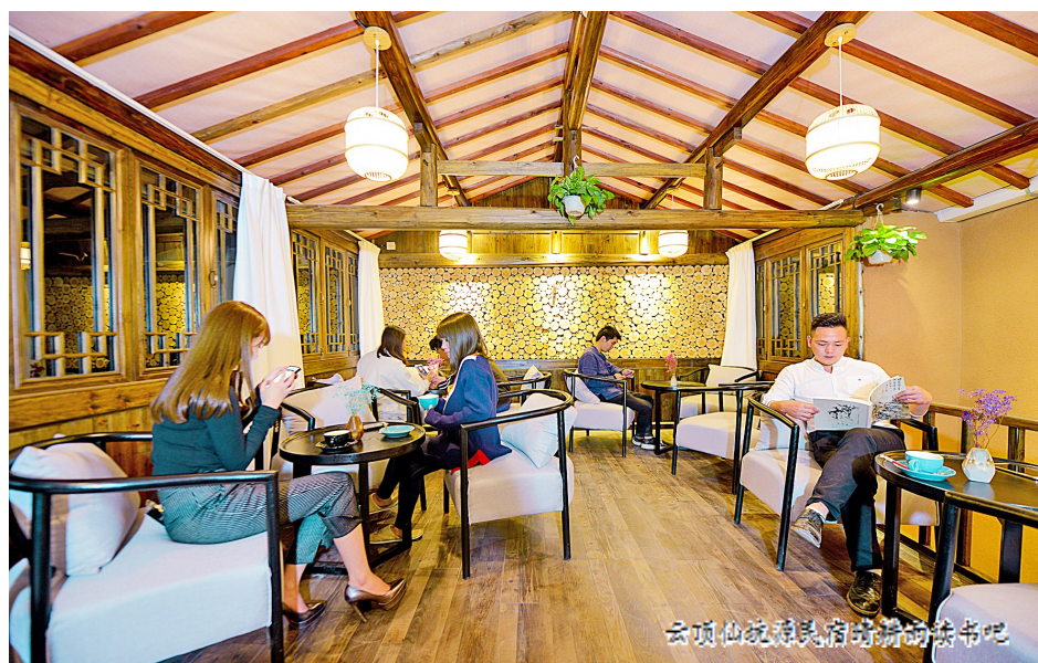
云景山院·松阳民宿