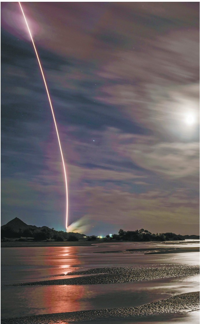
北京时间2021年10月16日0时23分,搭载神舟十三号载人飞船的长征二号F遥十三运载火箭,在酒泉卫星发射中心按照预定时间精准点火发射,顺利将翟志刚、王亚平、叶光富3名航天员送入太空。