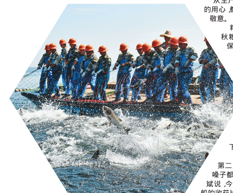
9月23日,千岛湖发展集团的捕捞队员在浙江省淳安县千岛湖安阳口水域进行巨网捕鱼。