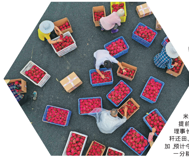
7月17日,在贵州省习水县同民镇同民村农业生态园,村民在分拣、包装火龙果。

这是天道酬勤的硕果,这是致敬耕耘的礼赞,这是亿万农民汗水描绘的画卷,这是古老农耕文明焕发的小康新颜。