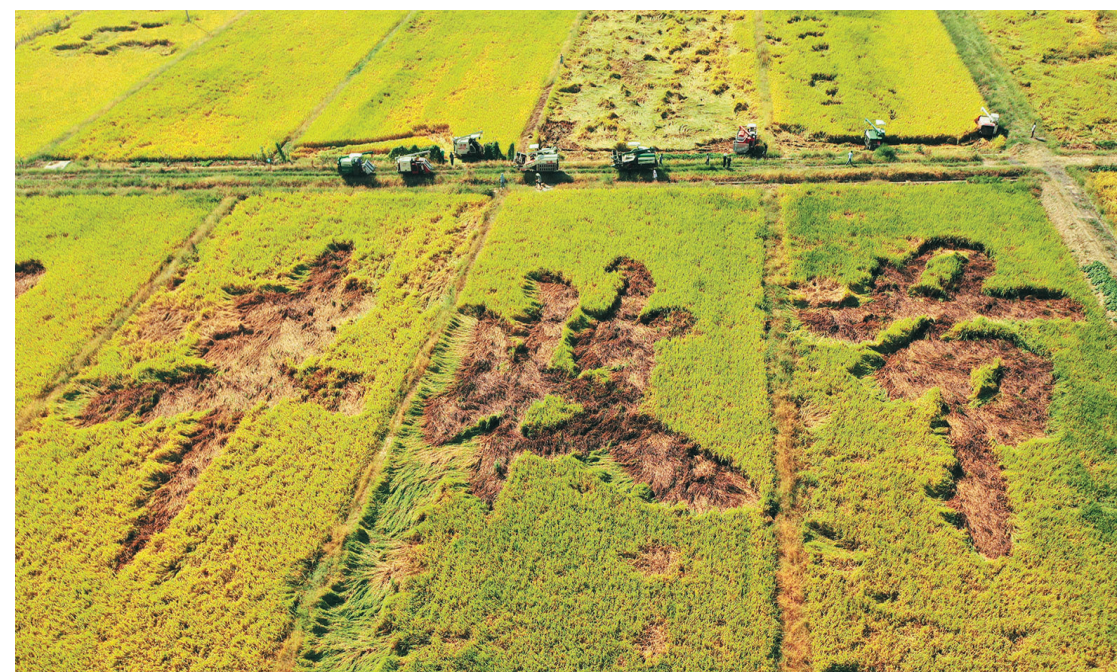
9月22日,在湖南省衡阳市衡阳县库宗桥镇,农机手驾驶农机准备收割稻谷。

第三次全国农作物种质资源普查与收集行动的一个普通片段,却是我国实现种源自主的基础。有种子,就有希望;有信心,就有力量。