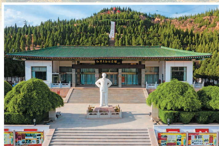
石楼红军东征纪念馆。

成绩催人奋进,实干托举梦想。当前的吕梁,各行各业都呈现出一派新气象、新面貌,全市上下把吕梁精神用在当代,鼓足信心、脚踏实地,团结奋进,向着高质量发展的康庄大道阔步前行。(本报记者 麻凯程 整理/文)