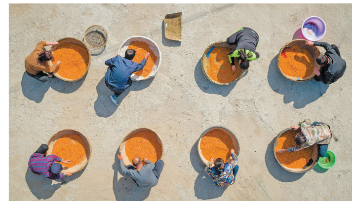
方山县邵家庄村民对采摘的沙棘进行二次筛选。