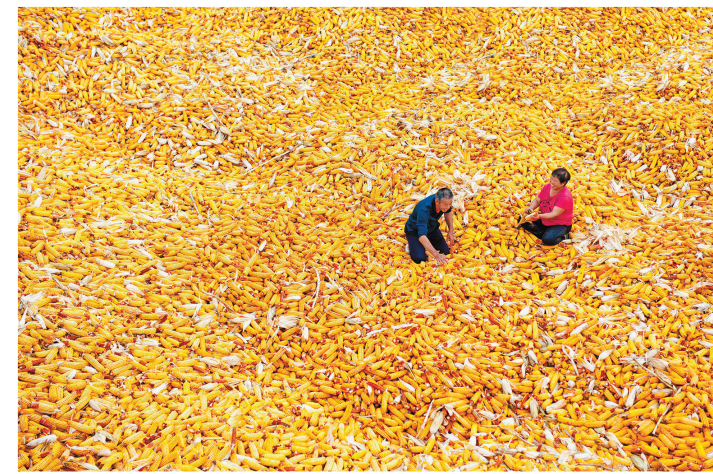
汾阳肖家庄镇八十堡村玉米丰收,农民在玉米堆上话收成。