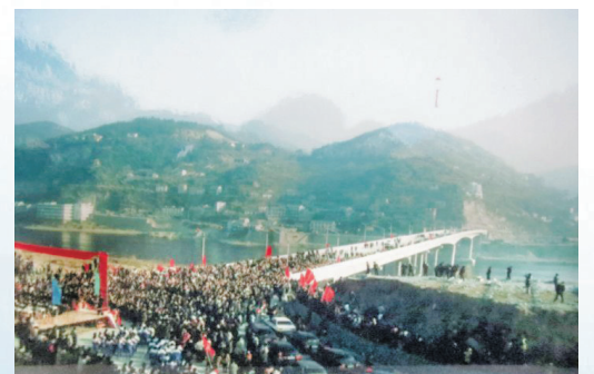
1995年5月27日在水南村头西门大桥南岸，举行大桥通车典礼时的热闹场面。