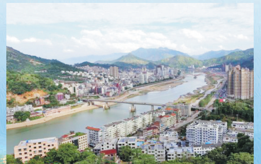
西门瓯江大桥全景。