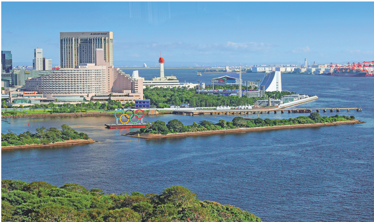
7月17日,一座奥运五环标志飘浮在日本东京湾。东京奥运会将于7月23日举行开幕式。 新华社传真