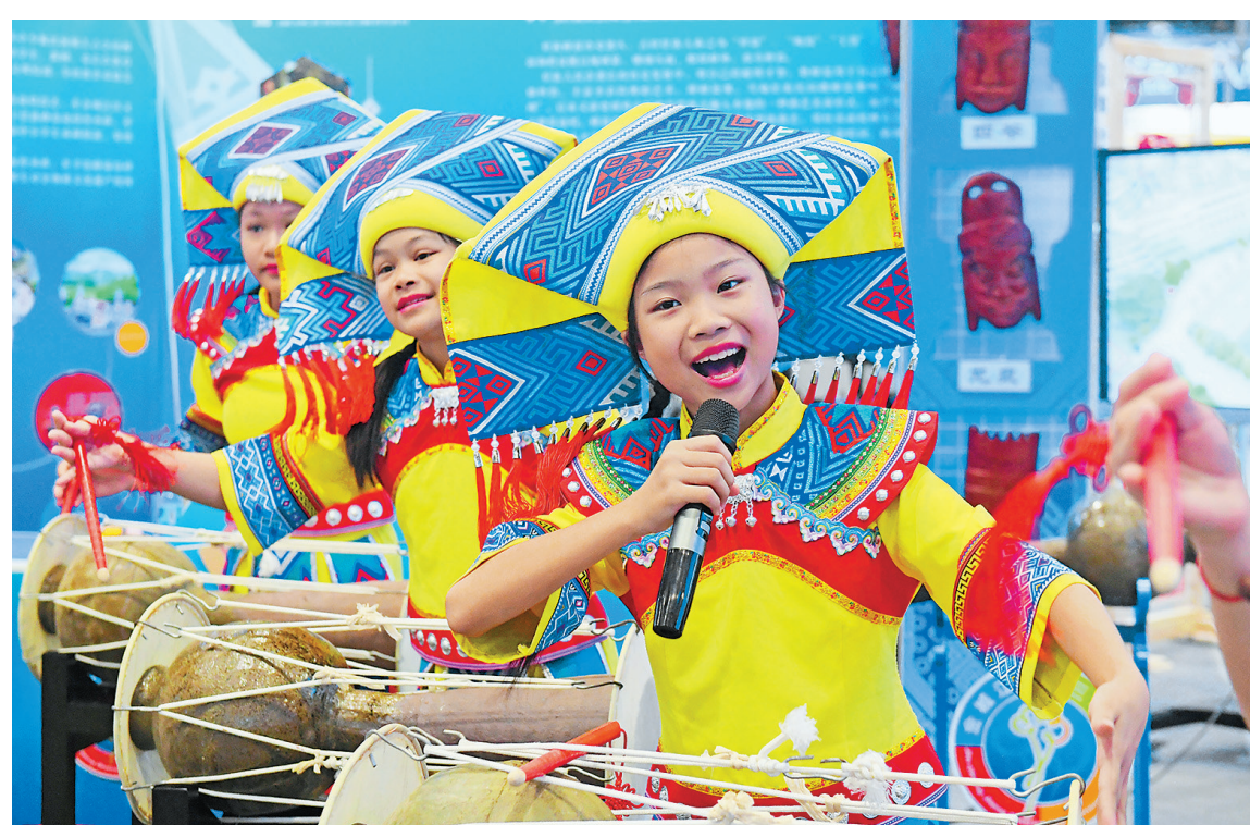
7月10日,在南宁国际会展中心,来自广西河池市金城江区第三小学的学生在壮族蜂鼓文化展示节目中表演。