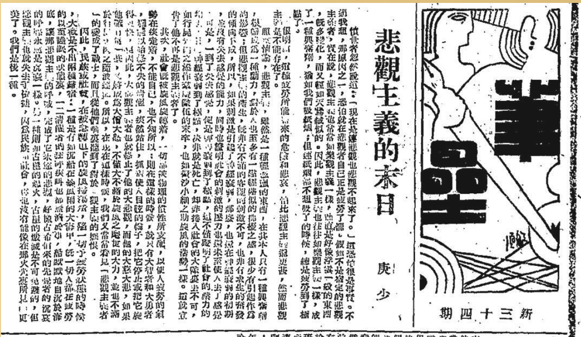
冯雪峰以化名“庚少”发表于1943年2月9日《东南日报》(丽水版)副刊“笔垒”上的评论文章《悲观主义的末日》

冯雪峰是当代著名诗人、作家、文艺理论家、社会活动家、鲁迅研究专家、中国革命文学奠基人之一。1942年底至1943年,正值艰苦抗战之时,这位红色作家在丽水养病与写作半年有余,他以笔代枪扬正声,针砭时弊,唤起民众的斗志,筑起抗战的“墨堡笔垒”。