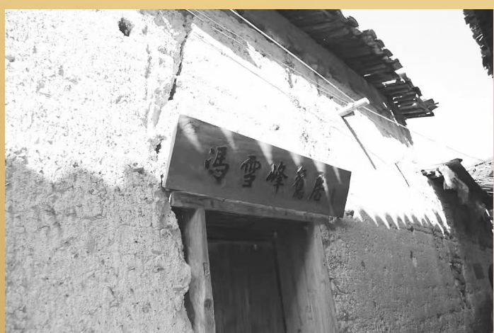
位于云和湖滨村小顺堡自然村的冯雪峰旧居

冯雪峰后来在回忆金瑞本时写道:(金瑞本)几乎以一人之力在恢复一张报纸。而且他是患着严重的肺结核病,又很穷,报纸也无钱,人手更不够;报纸出版后,他就非一个人兼做四五个人的事不可。至少因为他是总编辑,有时一大张报非由他一人编辑不成。这样,病自然是更严重起来了,而他的情绪也就显露了出来,时常在谈话的时候,一边咳嗽着,红着脸,喘着气,流露着种种深积着的牢骚,而一边却计划着即刻恢复副刊,训练编辑人材,在沦陷区建立通信网,等等。