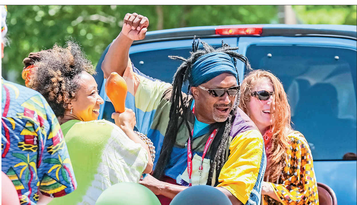
6月19日,民众在美国伊利诺伊州埃文斯顿参加六月节庆祝活动。 美国国会参议院6月15日举行投票,一致通过将6月19日黑人解放日定为联邦公共假日的法案。非洲裔美国人从19世纪末开始庆祝这一节日,将其称为解放日、自由日或六月节。

◆详解丽水“一脉三城”未来前景 ◆透视2021年丽水楼市 ◆解读“三城”在建待建重点楼盘