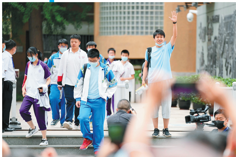
6月7日,在北京市陈经纶中学考点,考生在结束高考首场科目考试后走出考点。