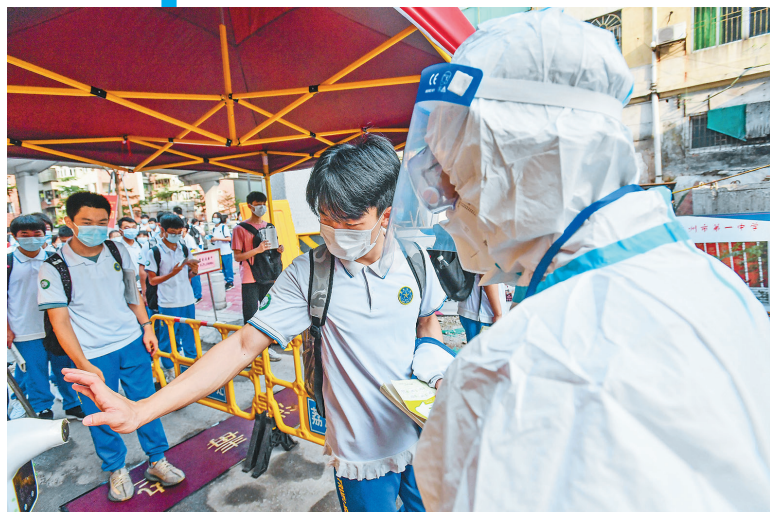
6月7日,真光中学考生进入广州市第一中学考点时测量体温。