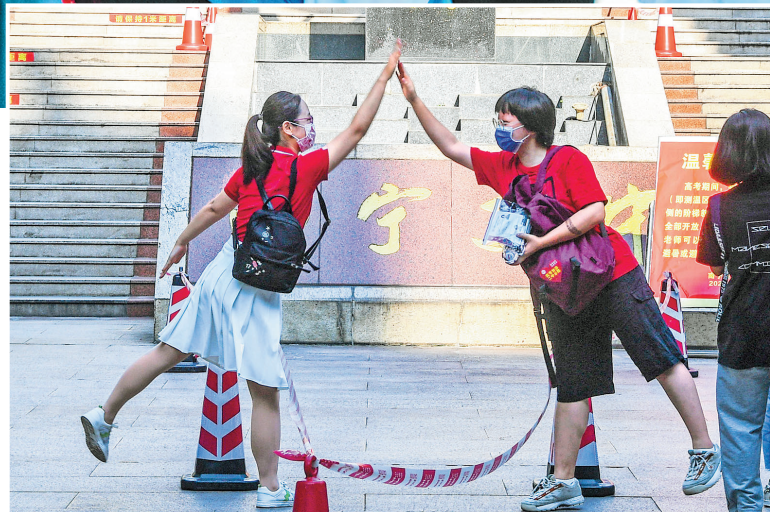
6月7日,在广西南宁市第二中学新校区考点,老师(左)与考生击掌。