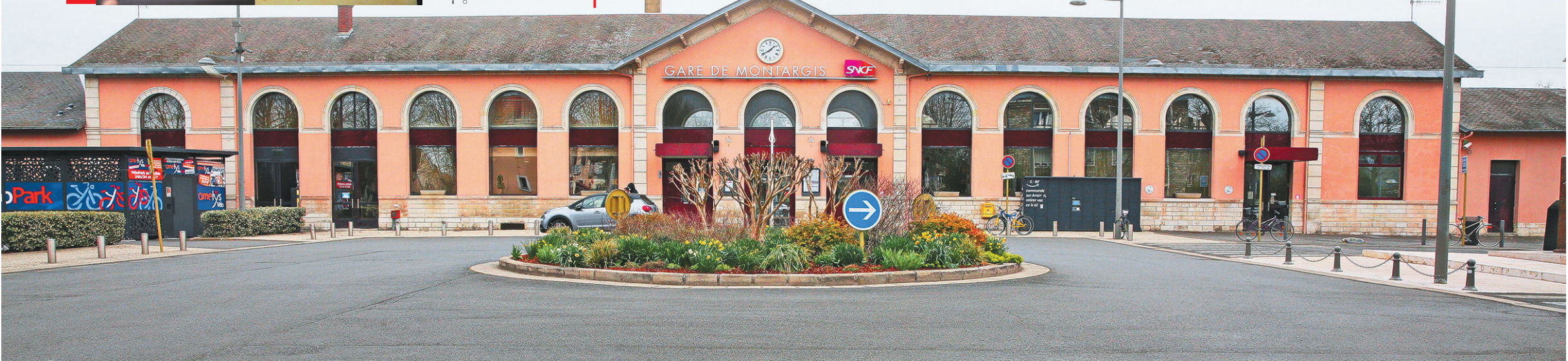
这是2021年5月22日拍摄的法国蒙达尔纪火车站前的“邓小平广场”。