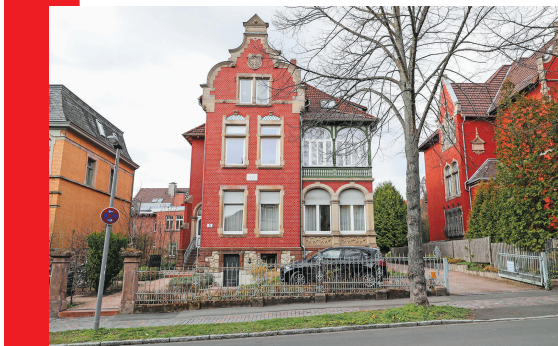
这是2021年4月16日在德国哥廷根拍摄的普朗克街3号朱德故居。