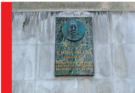
这是2021年4月11日在法国巴黎十三区戈德弗鲁瓦街上的“海王星旅馆”外拍摄的带有周恩来头像浮雕的纪念牌。