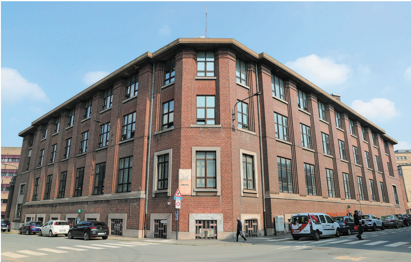
这是2021年4月20日在比利时南部城市沙勒罗瓦拍摄的沙勒罗瓦劳动大学图书馆。

从巴黎十三区意大利广场向西北走几十米，转进寂静的戈德弗鲁瓦街，街口墙上有一块纪念牌，牌上的头像浮雕是