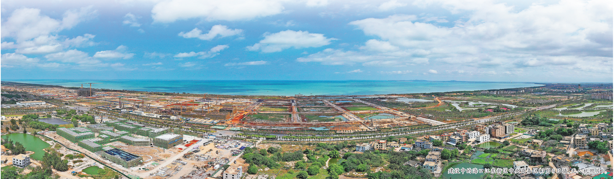
建设中的海口江东新区中央商务区(3月5日报,无人机照片)。