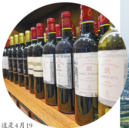
这是4月19日在海口日月广场免税店拍摄的免税商品。