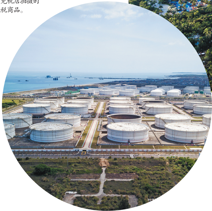
这是5月28日在海南海洋经济开发区拍摄的石化功能区(无人机照片)。