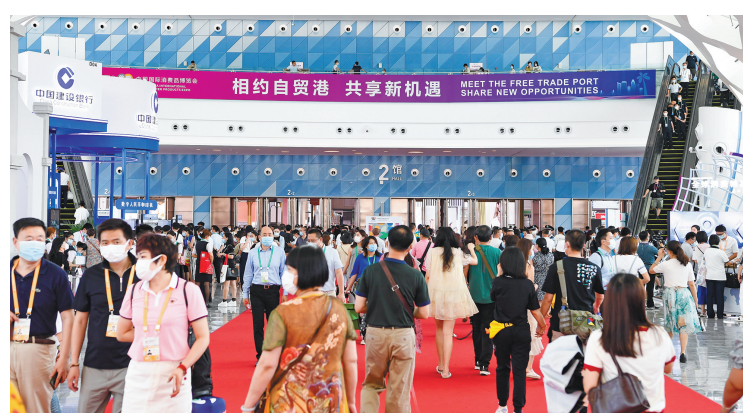
观众在首届消博会现场参观(5月9日报)。

近日,海南出台行动方案,明确未来三年投资新政策。在旅游业等三大产业基础上,将热带特