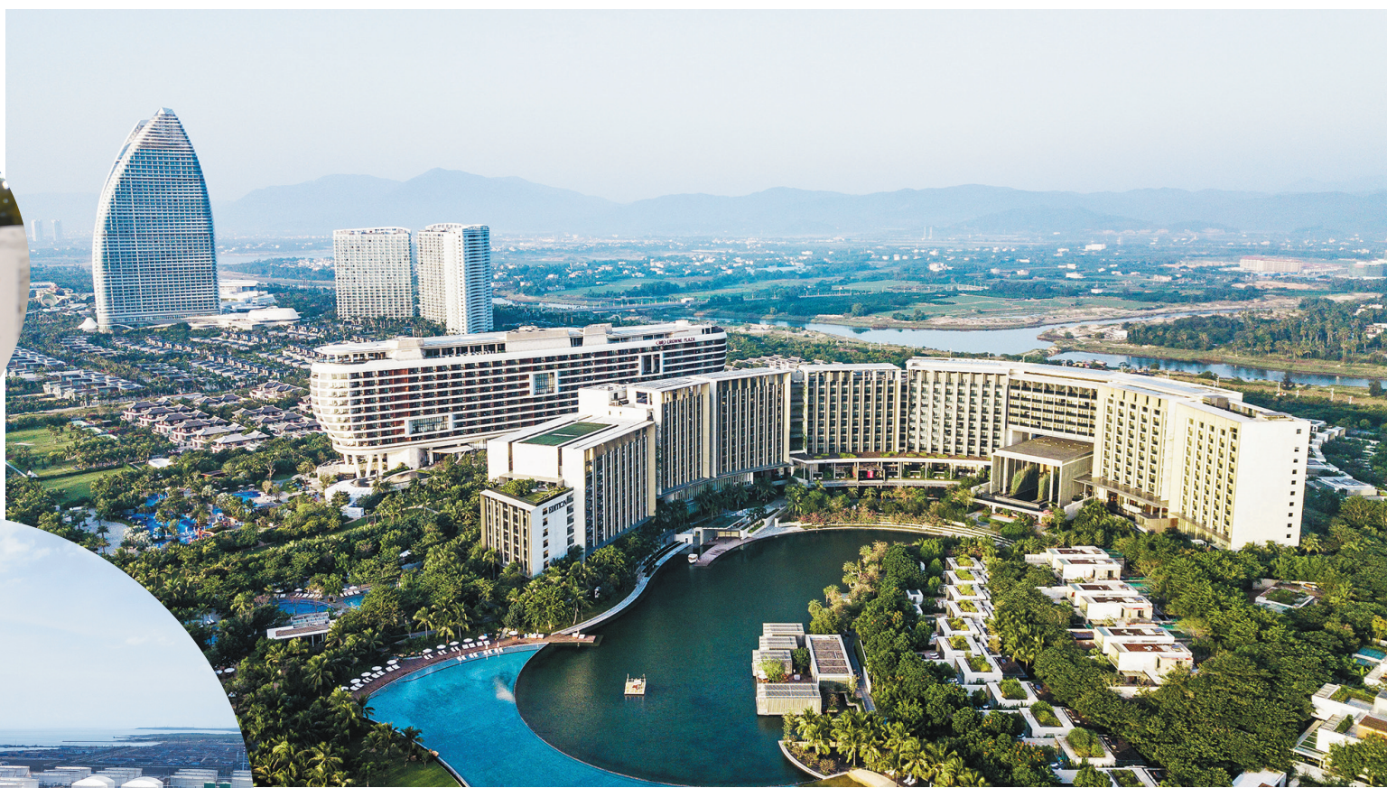
这是海南三亚海棠湾酒店群(无人机照片,2019年11月16日摄)。

两只海南长臂猿紧紧相拥,构成一个心形。这个名为“元宵”的首届中国国际消费品博览会吉祥物,不久前见证了全球精品在此集聚的盛况。