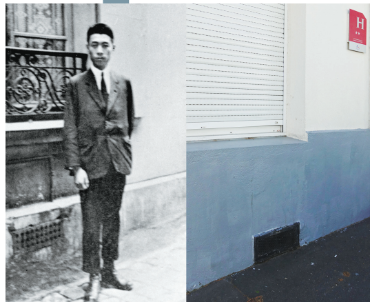
拼版照片显示的周恩来旅法期间在旅馆前留影的资料照片(左)和拍照地点现状。1920年,22岁的周恩来赴法。他在1922年至1924年期间曾住在这家小旅馆。