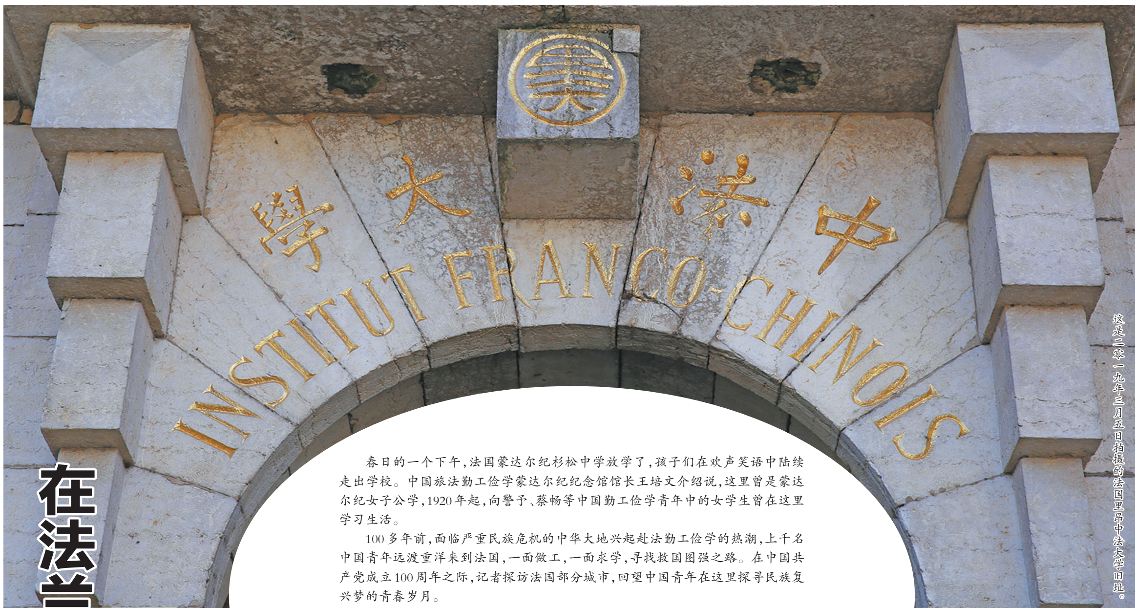
这是二零一九年三月五日拍摄的法国里昂中法大学旧址。