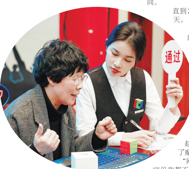
职业魔方B段(专业)考级通过。