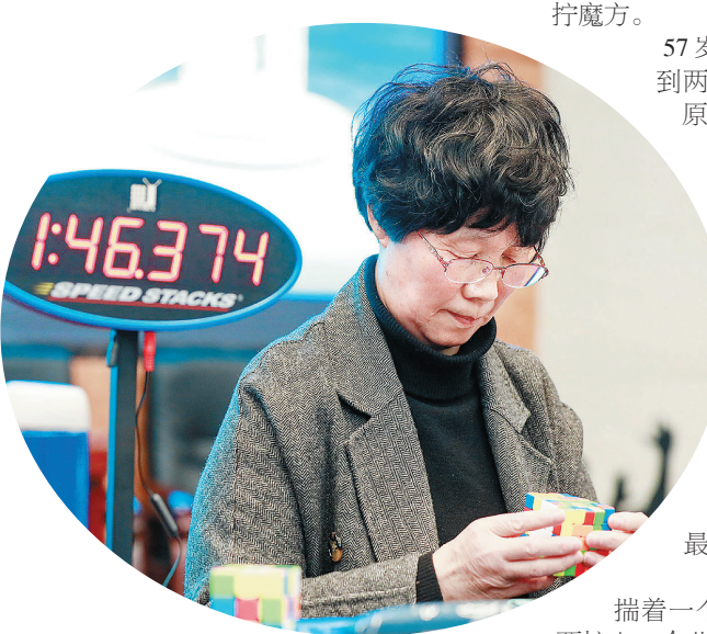
挑战职业魔方B段(专业)考级。