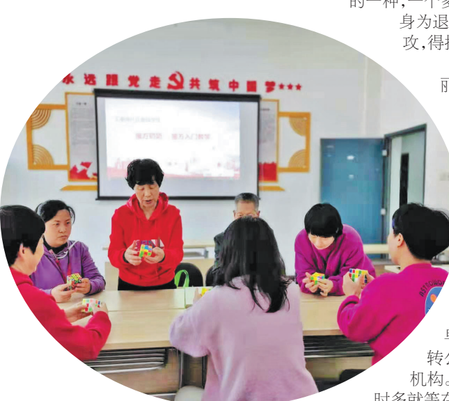
教社区居民拧魔方。