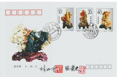
青田石雕邮票首日封。

这一切，在我人生的轨迹里留下难以忘怀的记忆。 (作者系青田县邮电局办公室原主任、青田县集邮协会原秘书长)