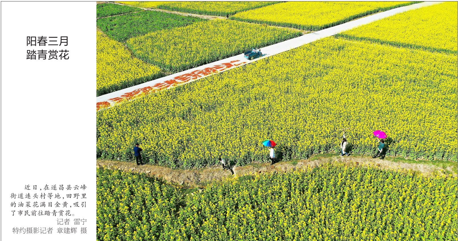
阳春三月 踏青赏花

近日,景宁红星街道组织干部和民兵开展红美人柑橘抢种行动。位于街道和兴村的启发蜈蚣山红美人基地原有红美人柑橘种植面积110余亩,今年初流转100余亩土地计划扩大种植红美人柑橘4000余株,红星街道组织干部和民兵开展精准助农,帮助农场主种植3000余株果苗,解决了基地人力不足无法及时下果苗的难题。 记者 陈炜 通讯员 吴珊 摄