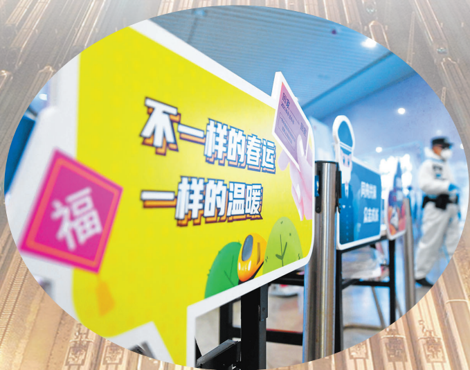
1月28日,石家庄火车站出站口。

春运是对交通运输部门的全面“体检”。交通运输部副部长刘小明表示,为了保障好顺畅回家路,交通部门将优化运力调配,科学安排班次计划,加大重点区域运力投放,切实提高旅客集疏运能力。加大城乡、镇村客运运力投入力度,提升农村客运班线覆盖面。 “铁路、公路、水路、航空企业要强化沟通协作,加强干线运输与城市交通衔接,切实减少人员聚集,有效解决旅客出行‘最先和最后一公里’问题。各地交通运输部门、铁路车站、机场要建立全面对接机制,精准调配道路客运,城市交通运力,统筹做好综合运输服务衔接工作,及时疏运旅客。”刘小明说。 中国国家铁路集团有限公司有关负责人表示,铁路部门将根据疫情防控形势和客流变化,加强大数据分析,实施“一日一图”,机动灵活、科学精准安排客运能力上线,满足出行需要。同时保持普速列车开行规模,坚持开好81对公益性慢火车,为群众提供基本出行服务保障。 保障顺畅返乡路,还要关注突发状况。回家路上如果出现突发疫情,引起交通管控、客流突变时该怎么办? “各地将围绕运输组织、安全应急、防控措施、客流研判等,提前制定应急预案,并切实加强应急运力、保障队伍和防疫物资储备,确保运力安全可靠、防疫物资正常运转。”刘小明说。