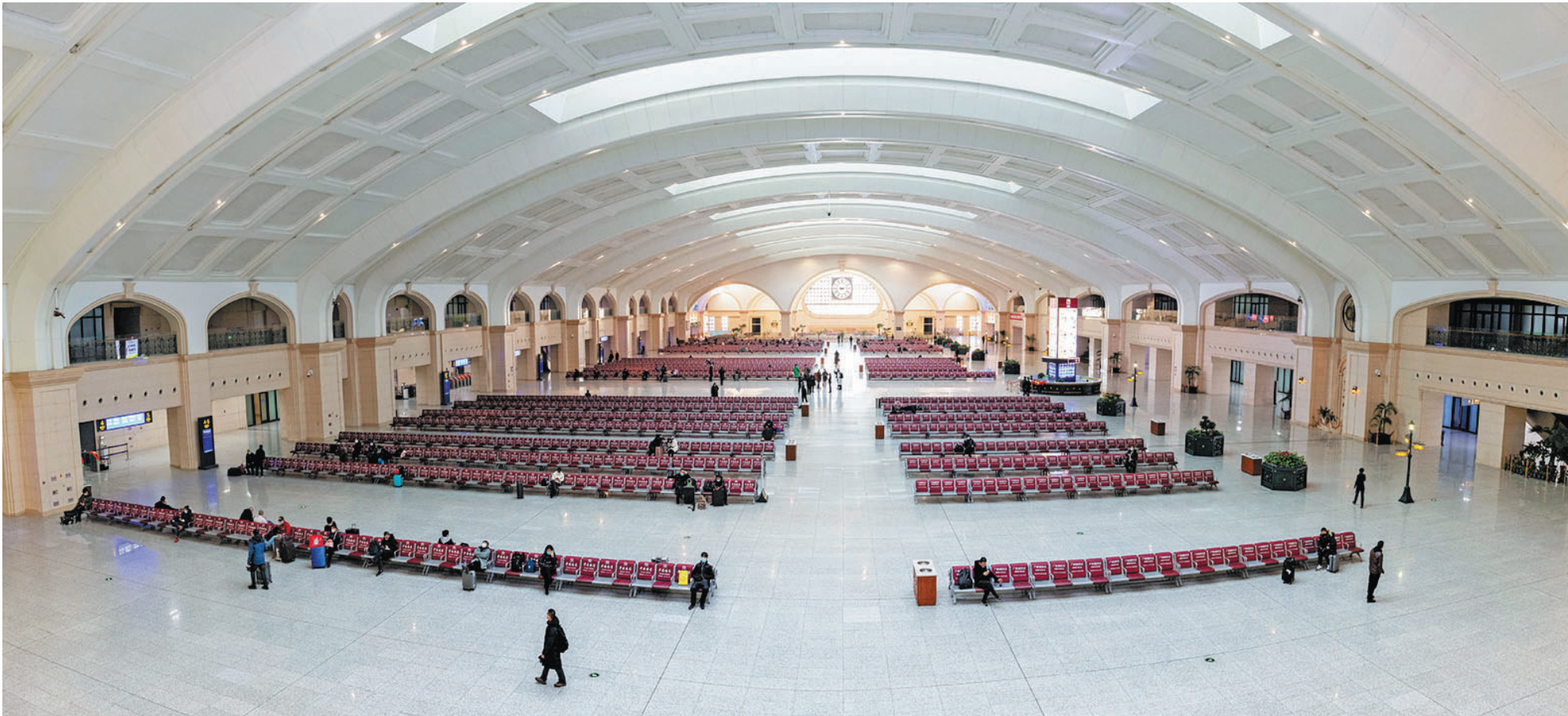
1月28日,在哈尔滨火车站候车厅,旅客在候车。

28日,2021年春运大幕开启。与往年春运不同的是,“疫情防控”成为今年春运工作的重中之重,“就地过年”成为越来越多人的选择。 在当前国内外疫情防控形势依然严峻复杂情况下,如何确保疫情不因春运扩散,同时加强运输组织和服务保障工作,确保人民群众健康安全平稳有序出行?记者带你一起走进这个“不一样”的春运。