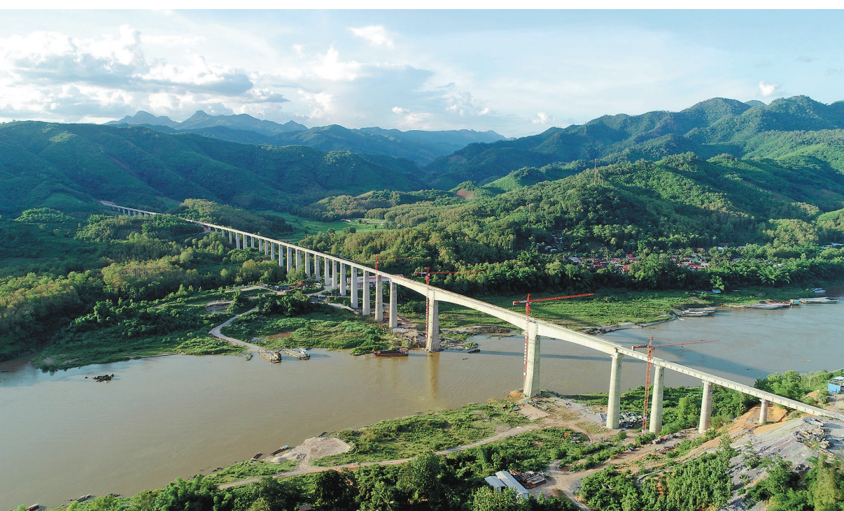
这是2020年7月15日拍摄的中老铁路班纳汉湄公河特大桥(无人机照片)。