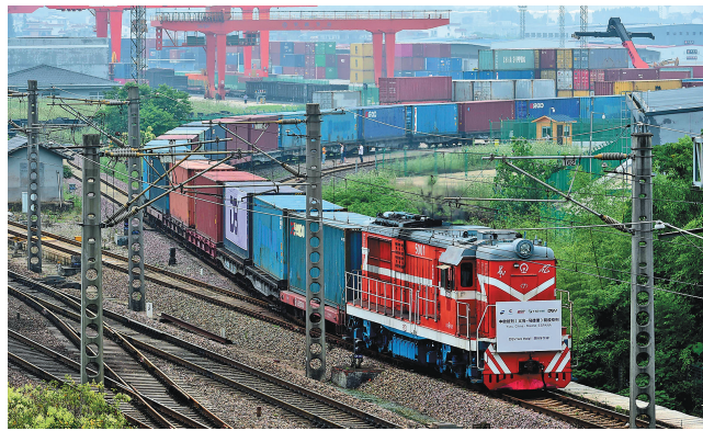
这是2020年6月5日,满载防疫物资的“义新欧”中欧班列(义乌-马德里)在义乌西站启程,前往西班牙首都马德里。