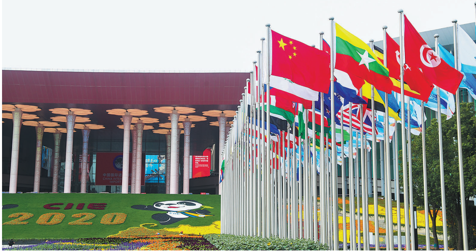
这是2020年11月2日拍摄的第三届中国国际进口博览会会场——国家会展中心(上海)南广场。

引领时代的思想,凝聚共识的智慧,破解危局的良方。构建人类命运共同体理念,如浩荡东风吹拂大地,播下和合共生的种子,收获共赢共享的明天。