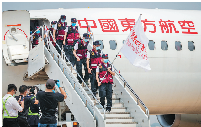
2020年3月29日,在老挝首都万象瓦岱国际机场,中国抗疫医疗专家组成员走下飞机。