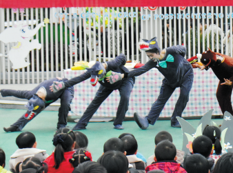
丽水学院幼师学院“绘本剧进校园”活动

四十多年来，学校奉行“服务学生发展，奉献社会事业”的办学理念，坚持走内涵发展道路，立足本市，面向周边，全力推进浙西南幼儿教师教育基地建设。