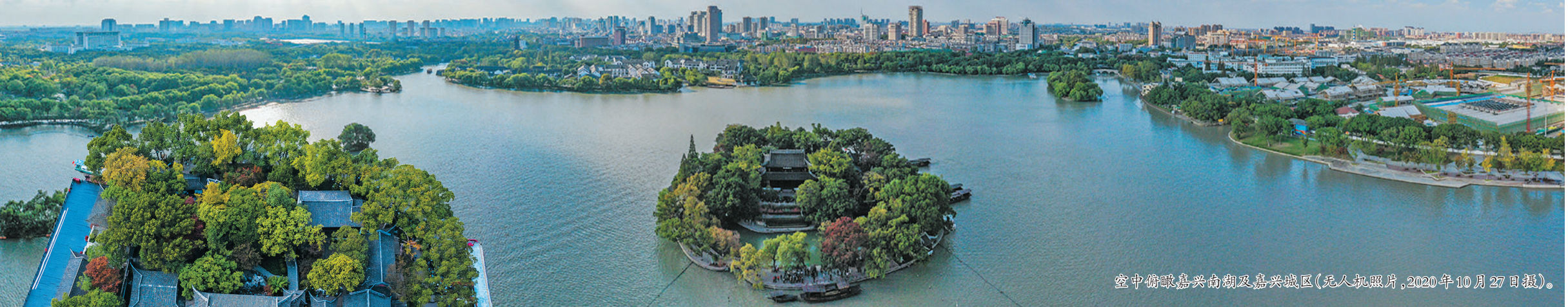
空中俯瞰嘉兴南湖及嘉兴城区(无人机照片,2020年10月27日摄)。