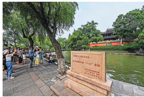
7月1日,游客游览嘉兴南湖景区的中共一大会议址。