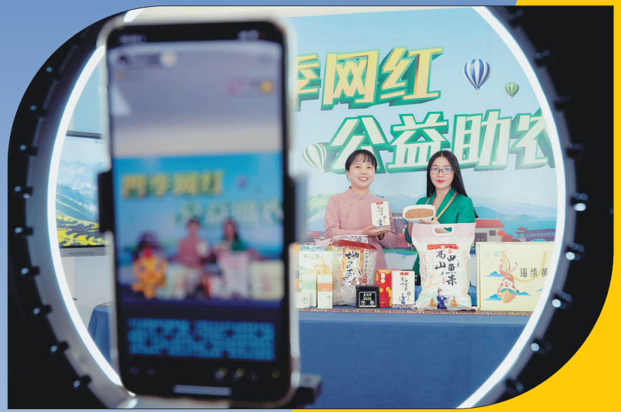
直播! 2020年,直播带货成为年度热词。在景宁,有一支“奋里云集”助农团队,他们把直播间搬到田野山林,除了卖农产品,还“卖风景”“卖文化”,用镜头和文字记录乡村的风土人情。 记者 陈炜 通讯员 陈亨明 摄