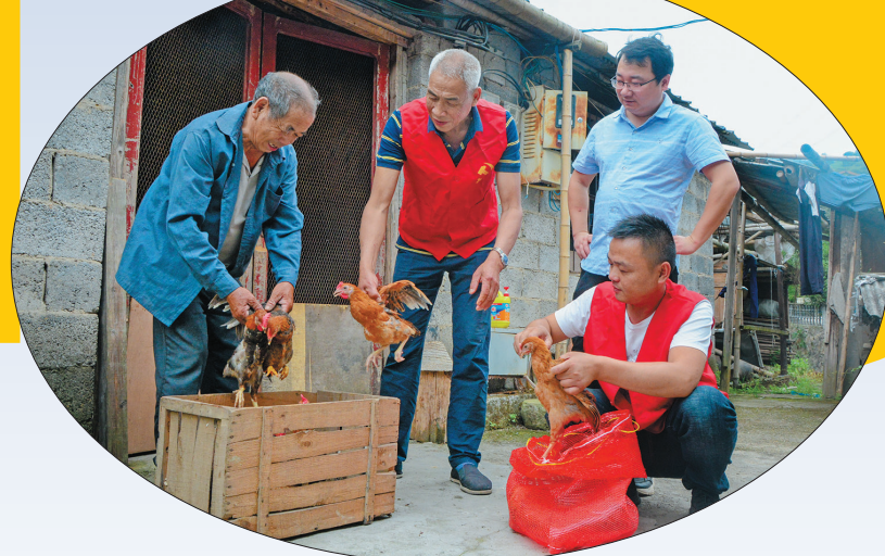
脱贫致富! 2020年5月28日,松阳县裕溪乡高溪村党员结对低收入农户,将自购购买的鸡蛋送到农户家中。同时,双方签署帮扶双向约定,等到鸡蛋符合出栏条件时,结对党员将按照市场价回购,以“授人以渔”的方式帮助贫困户发展养殖业,拓宽增收渠道,为贫困户脱贫致富夯实基础。