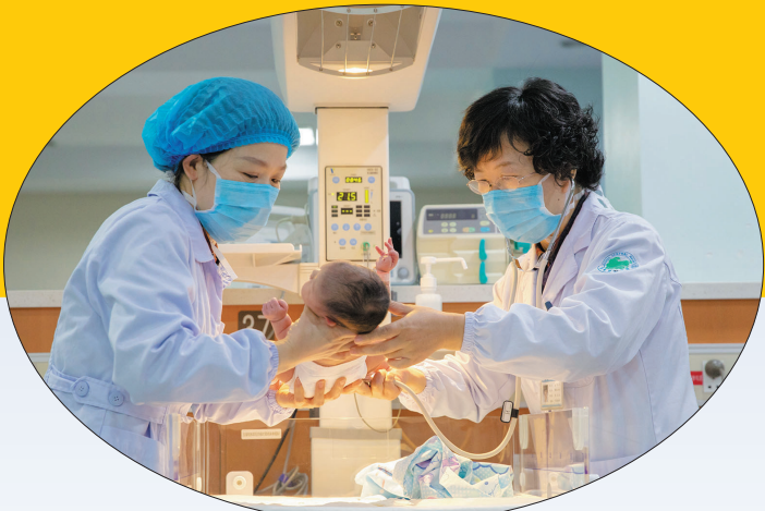
守护! “孩子我们来守护,请您放心!”疫情防控期间,医院新生儿科的医护人员坚守岗位,不分日夜,呵护新生,将热心、耐心、细心、责任心融化成一颗颗滚烫的爱,为新生儿监护室的宝宝保驾护航,撑起一片希望的天空。