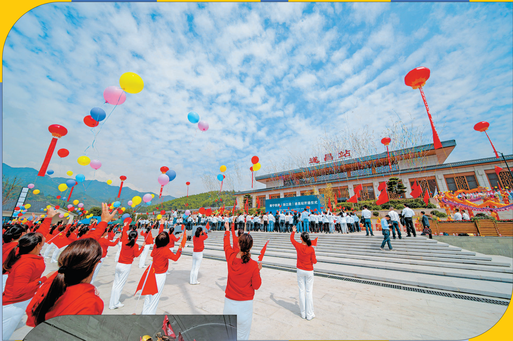
圆满! 2020年9月27日,衢宁铁路正式开通运营,自此结束了我市遂昌、松阳、龙泉、庆元4县市不通铁路的历史。衢宁铁路北连江南文化名城衢州,南接闽东重镇宁德,正线全长379公里,沿线山川秀美、峰峦起伏,串联起山与海,是一条典型的山海文化旅游交流通道,也是一条脱贫线、致富线。

时光呼啸,2021年迎面到来了。这一年的迎新,特别需要仪式感,这一年的开端,需要更多情怀和力量。回望跌宕起伏的2020年,从国到家,都有许多不容易。新冠肺炎疫情之下,所有人都无法置身事外。幸好,我们仍怀有希望,仍抱有信心,仍怀揣着前行的力量。丽水市5批援鄂医疗队80名队员筑起防疫的铜墙铁壁,最终全部平安凯旋。更多白衣天使坚守在医疗一线,用勇气和温暖疗愈伤痛。有人在一线战斗,有人在角落里默默付出;是为了不让家人担心,撒谎去执拗卡点加班的“90后”;是连续20多天里给卡点送点心的老华侨;是隔着隔离门,那一句“我和孩子在家里等你”的告别…… 敢于直面人生,感受人生波折的苦涩,这不是英雄小说般的故事,这是每一位普通人的真实生活。每一个守望着的、奋斗着的、期许着的“我”和“你”,都值得为自己喝彩。 2020年,丽水还留下许多值得铭记的印记。衢宁铁路运营通车,跨山向海,铿锵前行,承载庆元、龙泉、松阳、遂昌四县人民全面小康的“铁路梦”,一朝梦圆!“智汇丽水”人才科技峰会迈入第九个年头,群贤毕至,处士生辉。国家公园创建号角吹响,点绿成金展示“美丽名片”。网课、直播带货走进生活,“云端相见”成为日常。 雁过留痕,那些难忘的日夜,平凡的身影,终将被载入史册。2021年,是中国共产党成立100周年,是“十四五”开局之年,这是全新的征程,是国家的,也是每一个人的。愿所有人都能找到自己的坐标,成为更好的自己。没有什么比内心的信念更加真切,没有什么比内心的力量更加坚忍。人间值得,信念与力量,终将越过烈火,抵达梦想。春天的萌芽,已然不远。 本报记者 曾翠/文