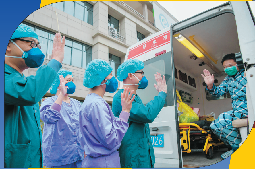
清零! 医护人员与最后一名出院的患者挥手告别。2020年2月27日,丽水新冠肺炎患者全部出院,为浙江首个清零市。从17例确诊到17例均出院,丽水市交出了100%出院的满意答卷。