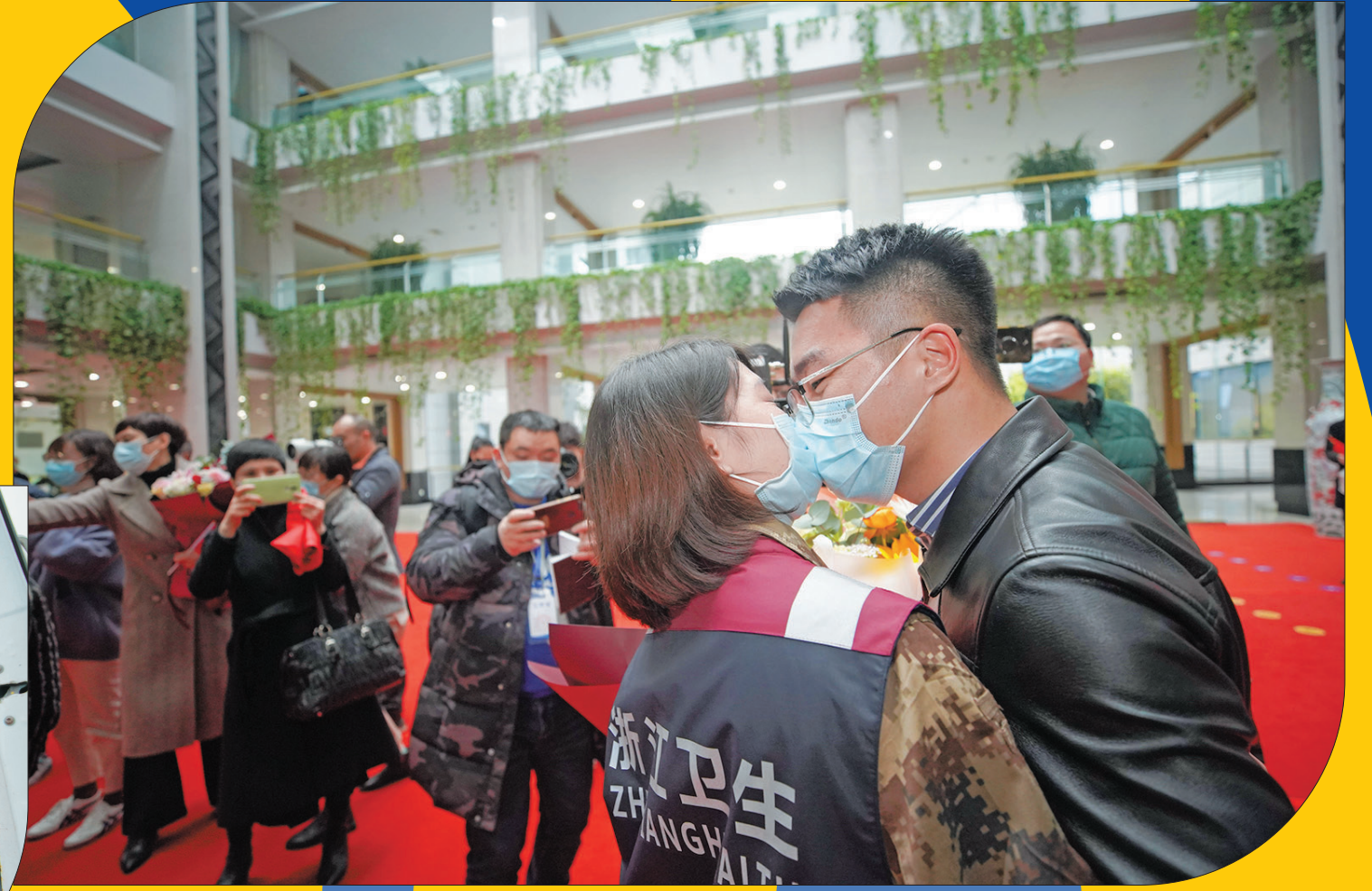
回家! 2020年4月3日下午,丽水市行政中心,丽水援鄂医疗队首批返丽队员隔着口罩与爱人亲吻,场面令人泪目。首批返丽援鄂医疗队是丽水市第三批出征援鄂的医疗队,他们1月28日出征武汉,日以继夜奋战50多天,于3月19日返浙。在湖州安吉隔离休养14天,11名队员全部平安回家,“山河无恙,感谢有你!”