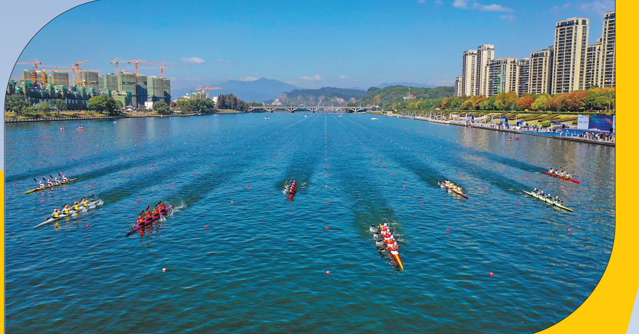
百舸争流! 2020年11月10日早上,2020年全国皮划艇静水锦标赛暨第十四届全国运动会皮划艇静水资格赛在我市水上运动中心开幕。该赛事是中国皮划艇协会主办的国内年度最高级别的皮划艇静水赛事,也是2020年落地我市档次最高、规模最大的国家级专业体育赛事。