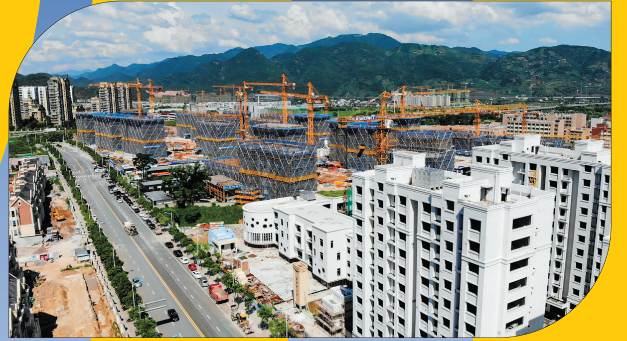
城中村改造! 丽水市区域城中村改造安置房建设有条不紊地进行,位置佳,设计棒,环境好,设施全,是真正的城市规划“让利于民”。2020年是市区域城中村改造三年行动计划的收官之年,全市上下拿出更大的决心、更强的力度、更实的举措,以冲刺决胜之势,高质量实现目标。