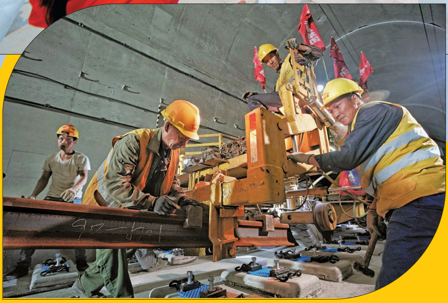
奋战! 2020年5月12日15时58分,最后一组钢轨在庆元葛蒲岗隧道就位,衢宁铁路全线贯通。在丽水境内159.18公里的铁路线上,来自全国各地的建设者们奋战施工。圆梦时刻,向建设者们致敬!