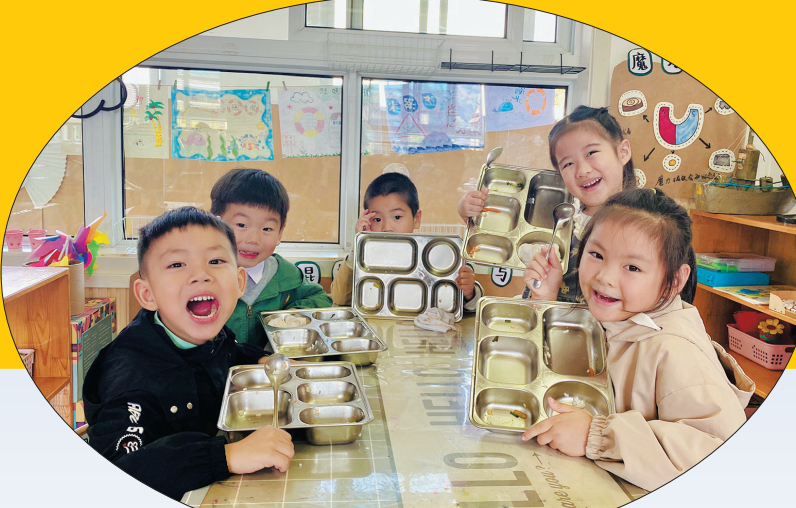
光盘! 莲都区大港头镇中心幼儿园开展“光盘行动”主题活动,通过丰富多彩的活动,培养幼儿节约粮食、爱惜粮食的好习惯,让幼儿以“光盘”为荣,以“节约”为耻,使每个孩子都成为“光盘达人”。