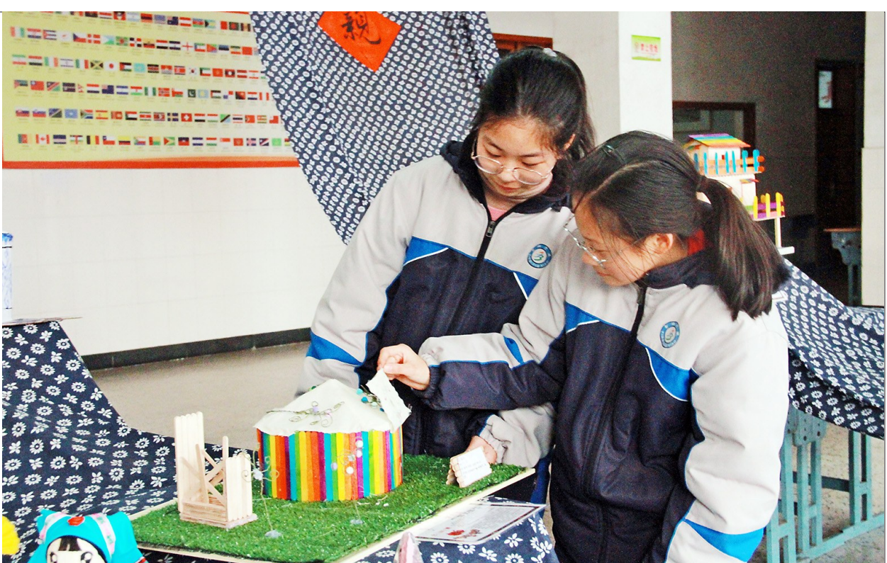
为丰富中学生校园生活,活跃校园民族文化,近日,缙云县新碧初级中学举行“民族特色展”——手工艺术大赛。比赛以“让民族文化在指尖传承”为主题,围绕“民族元素”开展不同类型的手工作品,七八九级分别制作“民族特色住所”“民族特色乐器”“民族特色衣服”。图为同学们在作品“蒙古包”前驻足观看。