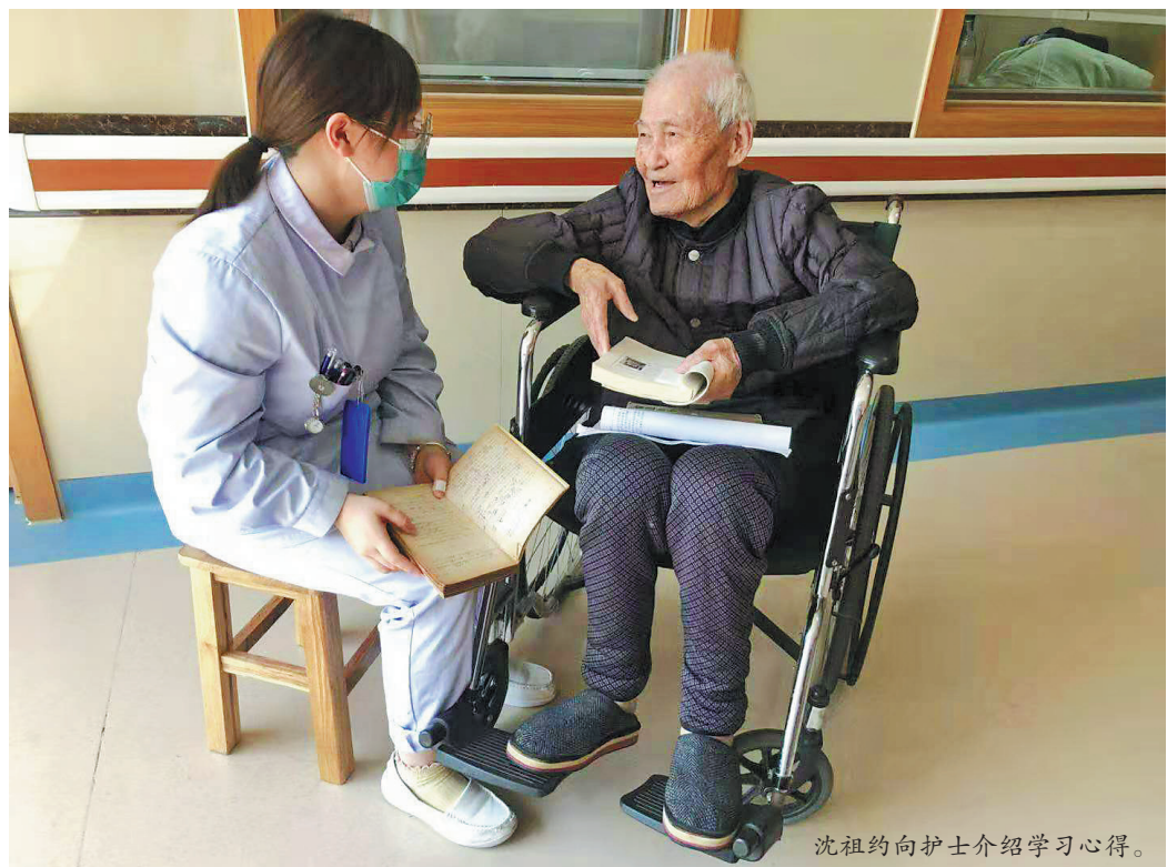
沈祖约向护士介绍学习心得。