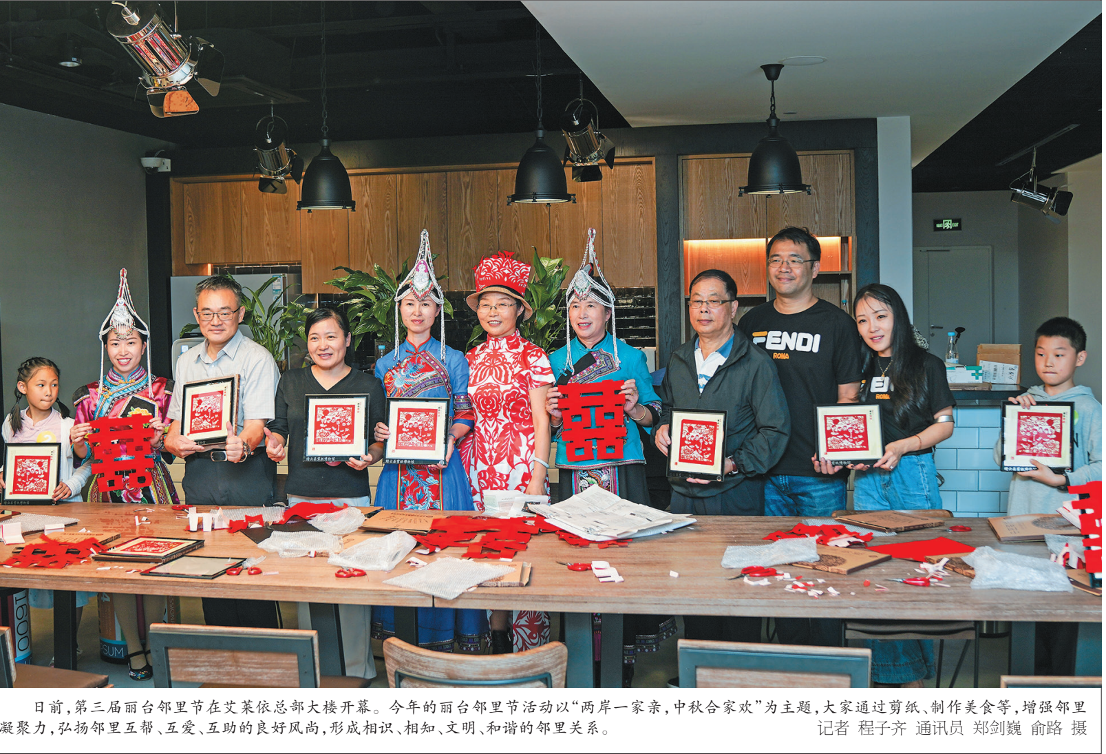
日前，第三届丽水邻里节在艾莱依总部大楼开幕。今年的丽水邻里节活动以“两岸一家亲，中秋合家欢”为主题，大家通过剪纸、制作美食等，增强邻里凝聚力，弘扬邻里互助、互爱、互助的良好风尚，形成相识、相知、文明、和谐的邻里关系。