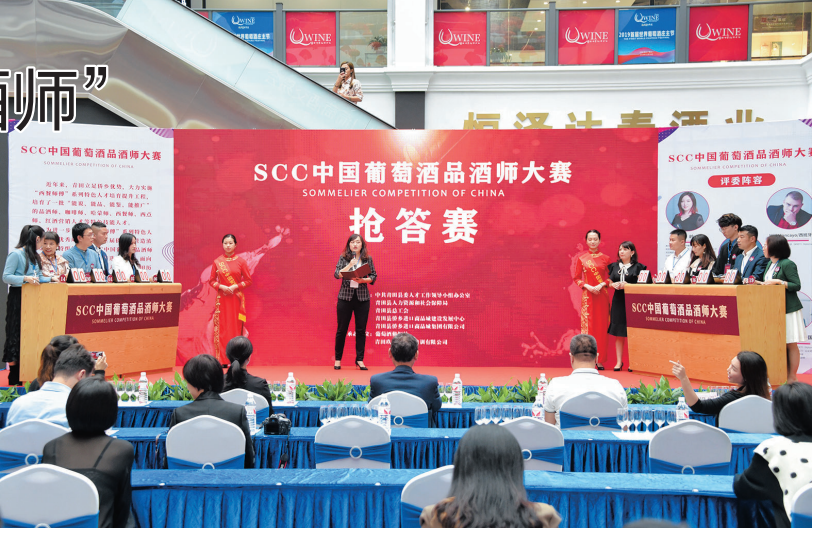
日前，2020年SCC中国葡萄酒品酒师大赛在青田世界红酒中心举办，来自全国各地及哈萨克斯坦等多个国家的30名参赛选手齐聚青田，现场角逐最强品酒师荣誉。