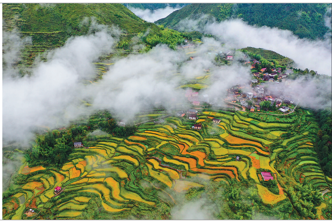
图为景宁畲族自治县鹤鹑乡葛山村风景(无人机照片)。

丹桂飘香,稻穗弯腰。连日来,位于浙南山区的丽水市景宁畲族自治县烟雨浙沥,稻菽争秋。静卧大山深处的层层梯田、山村屋舍,在云飘雾渺的山峦之间,金波碧浪,忽隐忽现,恍若仙境。