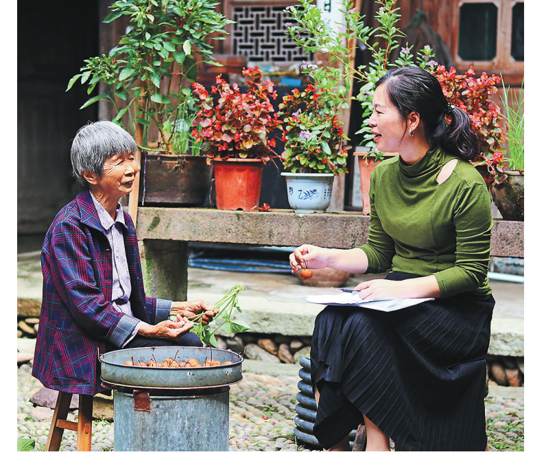
日前,莲都区组织党员干部到结对帮扶村开展走访慰问,帮助解决生活生产困难。图为丽新畲族乡干部正在向农户了解收粮情况。