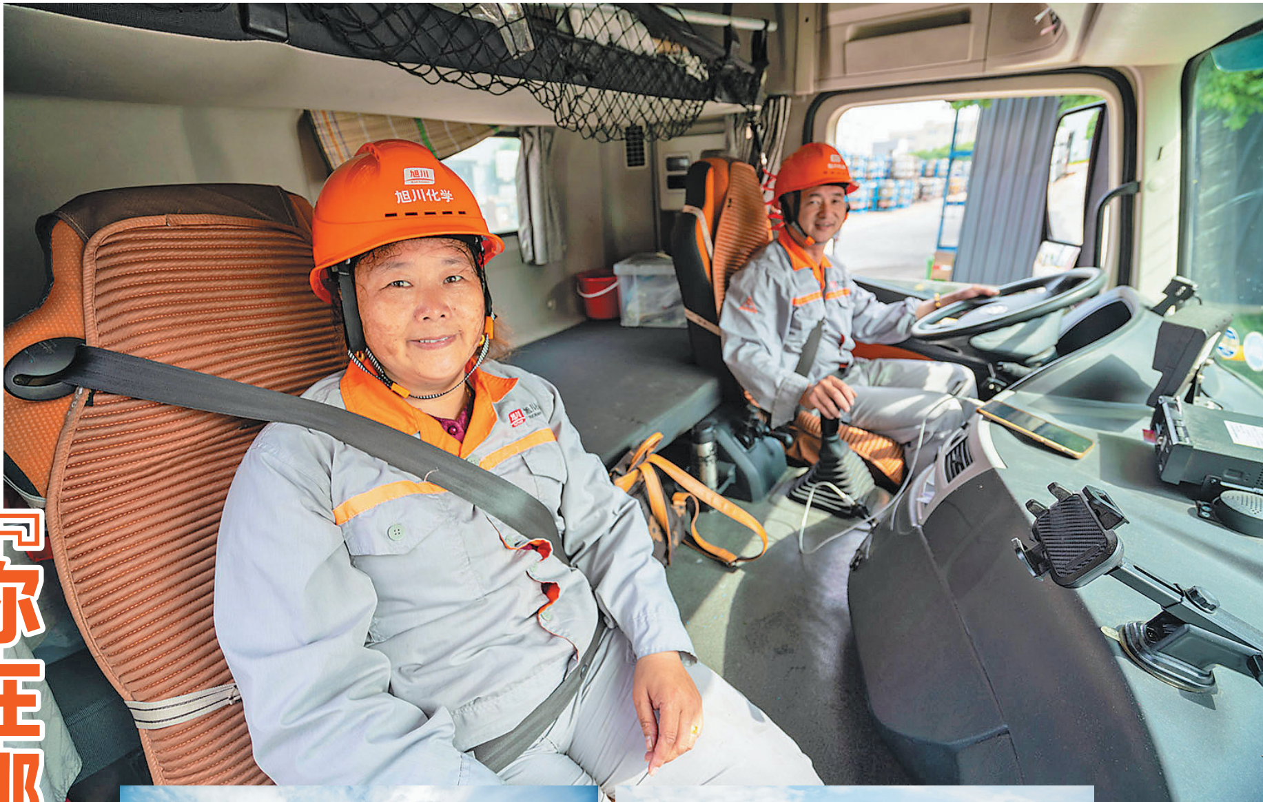
■本报记者 陈炜芬 蓝俊 通讯员 范慧建 文