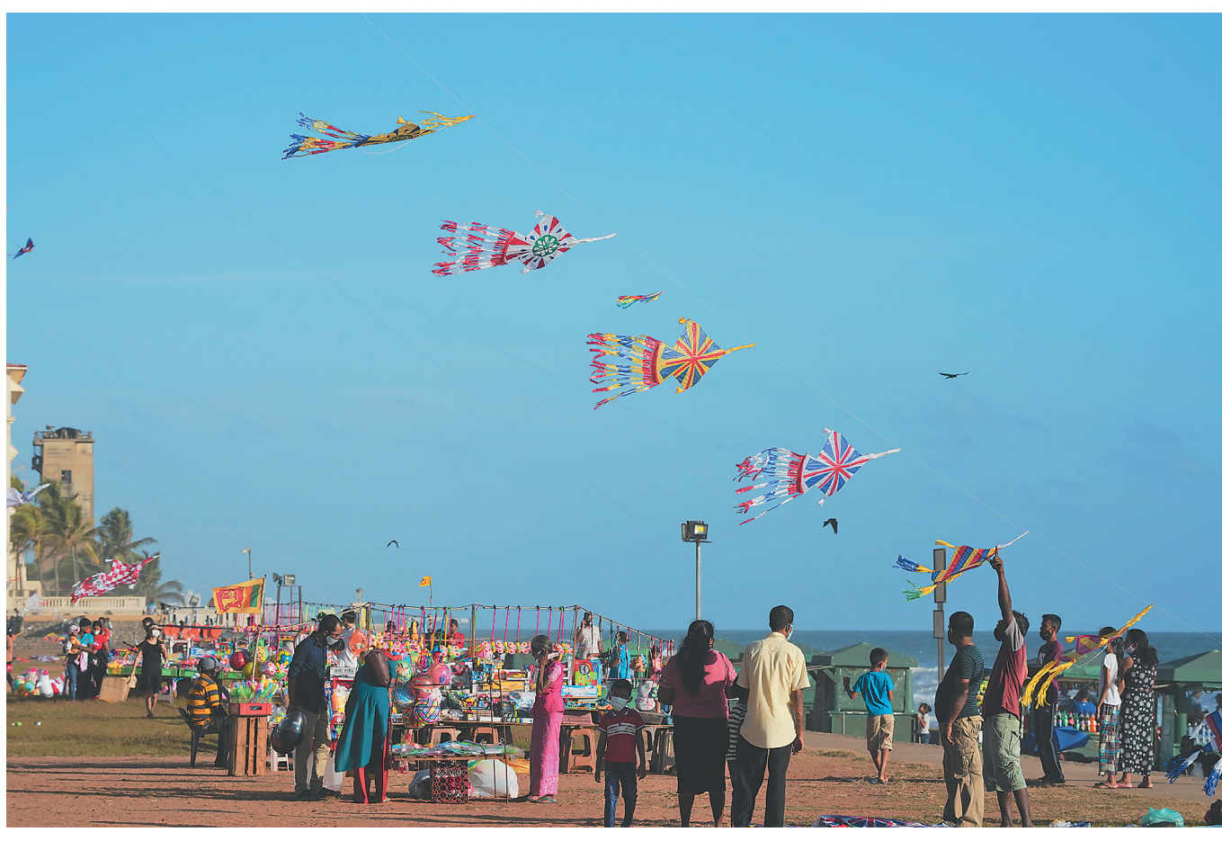
6月27日,人们在斯里兰卡科伦坡加勒菲斯绿地广场放风筝。

濒临印度洋的加勒菲斯绿地广场位于斯里兰卡科伦坡的金融和商业区中心,被誉为当地最大的开放空地。以往每到周末,许多科伦坡民众喜欢来到这里放风筝。新冠疫情发生后,加勒菲斯绿地广场曾一度空无一人。随着政府逐渐放松疫情防控措施,这里的人气逐渐恢复。6月27日是一个晴朗的星期六,很多民众举家出游,来到加勒菲斯绿地广场休闲、漫步。