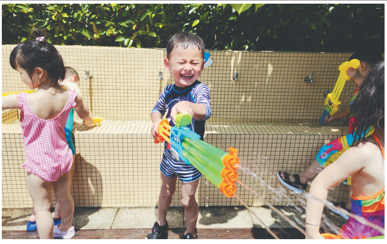
在炎热的夏日里,开展一次“打水仗”活动,不仅能体会到丝丝凉意,也能体验到游戏的快乐。近日,莲都区培红幼儿园的小朋友就开展了一场酣畅淋漓的“打水仗”活动。图为幼儿正在“打水仗”。