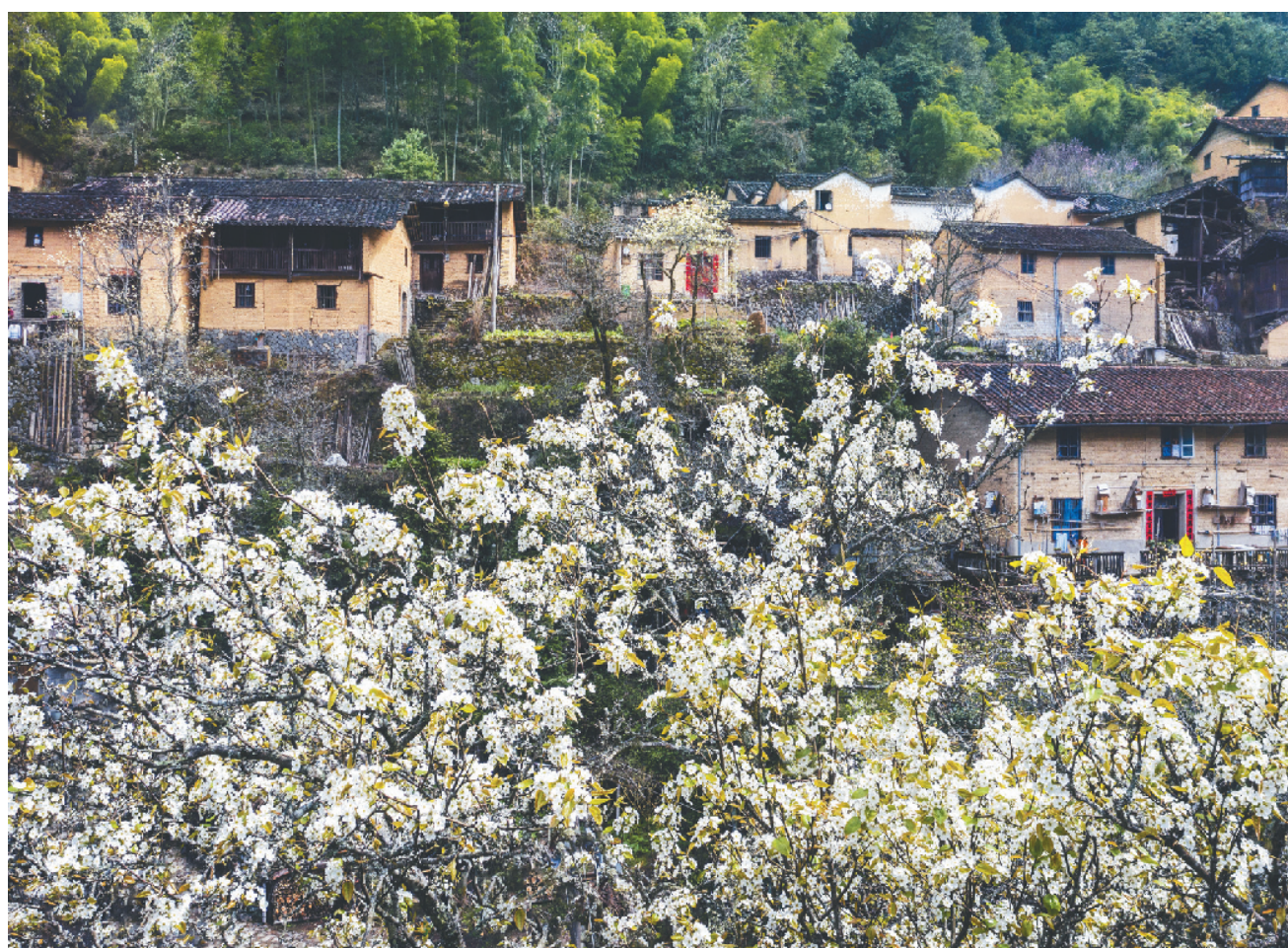
“燕子来时新社,梨花落后清明。”在这细雨纷飞的春天,最不能错过的,就是梨花。近日龙泉市屏南镇车盘坑村,一棵棵挺拔的梨树悄悄吐出了翠绿的嫩芽。雪白的梨花穿上了淡绿的春装,当春风吹来,梨花瓣瓣随风飘落,落英缤纷的小山村如画如诗。

本报讯(记者 麻萌楠 通讯员 金霞慧 张炳)清明小长假即将到来,据省交通集团丽水高速公路区域中心预测,4月4日至4月6日期间,我市高速公路收费站进出口总流量将达到37万辆次,同比增长42%;由于4月3日恰逢周五,当日午后车流就会逐渐攀升,15时至19时车流将明显激增并持续至晚间;预计4月4日上午9时为车流最高峰,4月6日当天13时至19时,返程车流激增,将再度形成高峰。