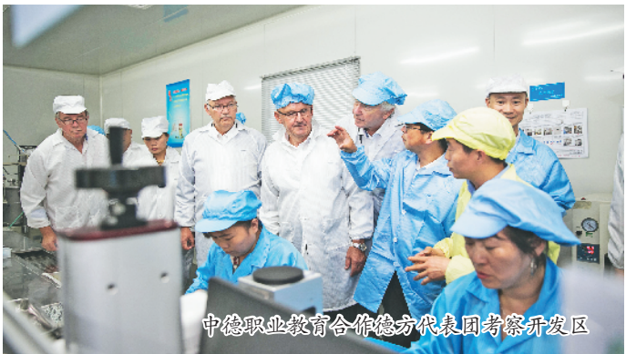
中德职业教育合作德方代表团考察开发区