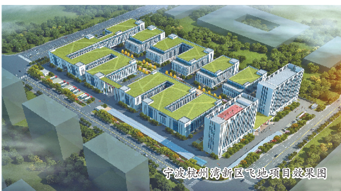
宁波杭州湾新区飞地项目效果图