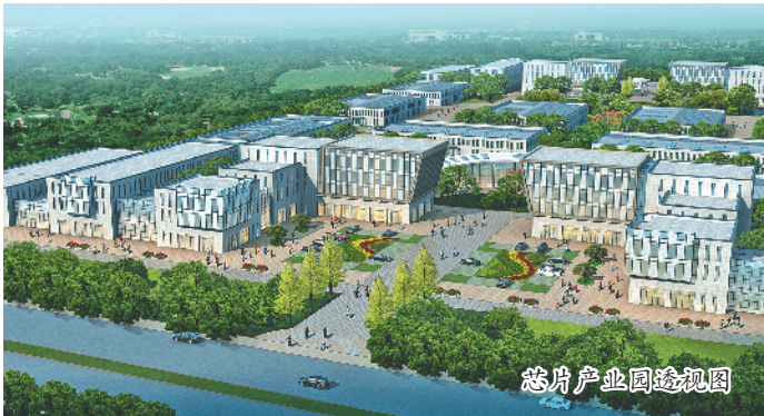
芯片产业园透视图

其实去年以来,丽水开发区就积极发挥国家级经开区的发展主平台作用,主动抢抓长三角一体化发展机遇,对标发达地区和一线城市,坚持以“接轨大上海、融入长三角”统领新一轮对外开放和创新发展,全面融入浙江“大湾区、大花园、大通道、大都市”建设,加快实现GDP和GEP的“两个较快增长”,推进高质量绿色发展“生态经济化、经济生态化”,进而构建现代化生态经济体系。