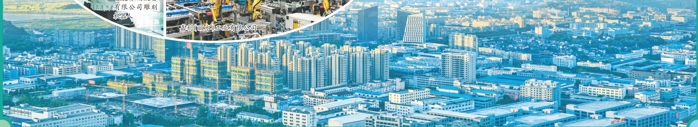
嘉利(丽水)工业有限公司