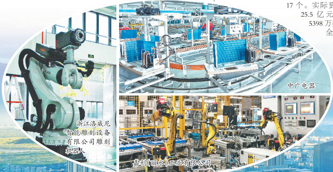
浙江洛威尼智能雕刻设备有限公司雕刻机器人

只争朝夕,不负韶华。当前的丽水开发区已进入到了“跨区域融合、通航通港、产城共融”的新阶段,相信通过全区干部群众上下同欲、实干巧干,一个齐步迈向“春天”的崭新开发区正昂首朝我们走来!