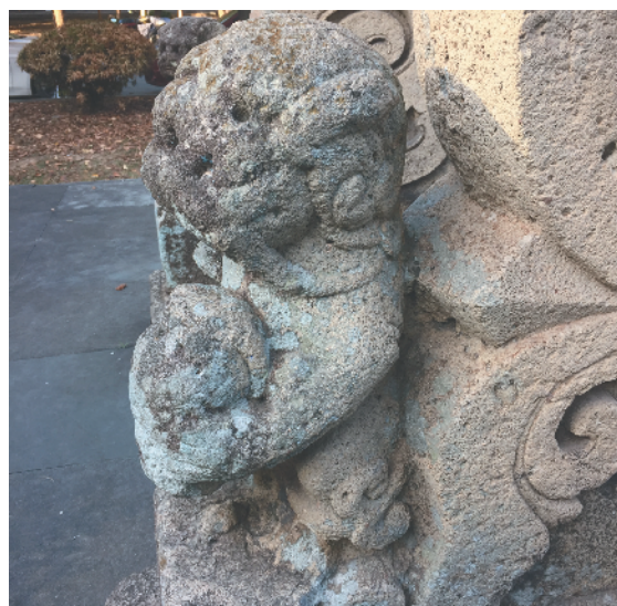
憨态可掬的母子狮。