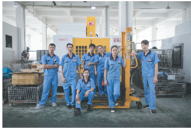
《工业园区的新主人》