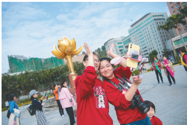
12月13日,旅客在澳门金莲花广场游览。