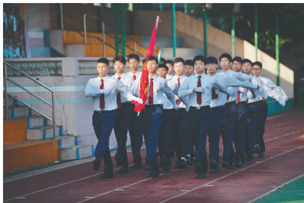
澳门濠江中学举行全校升国旗仪式(11月18日摄)。