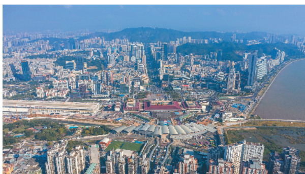
澳门关闸口岸和珠海拱北口岸一带的景色(11月10日无人机拍摄)。