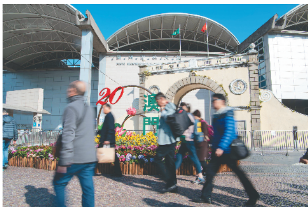
人们从澳门关闸口岸走过(12月12日摄)。