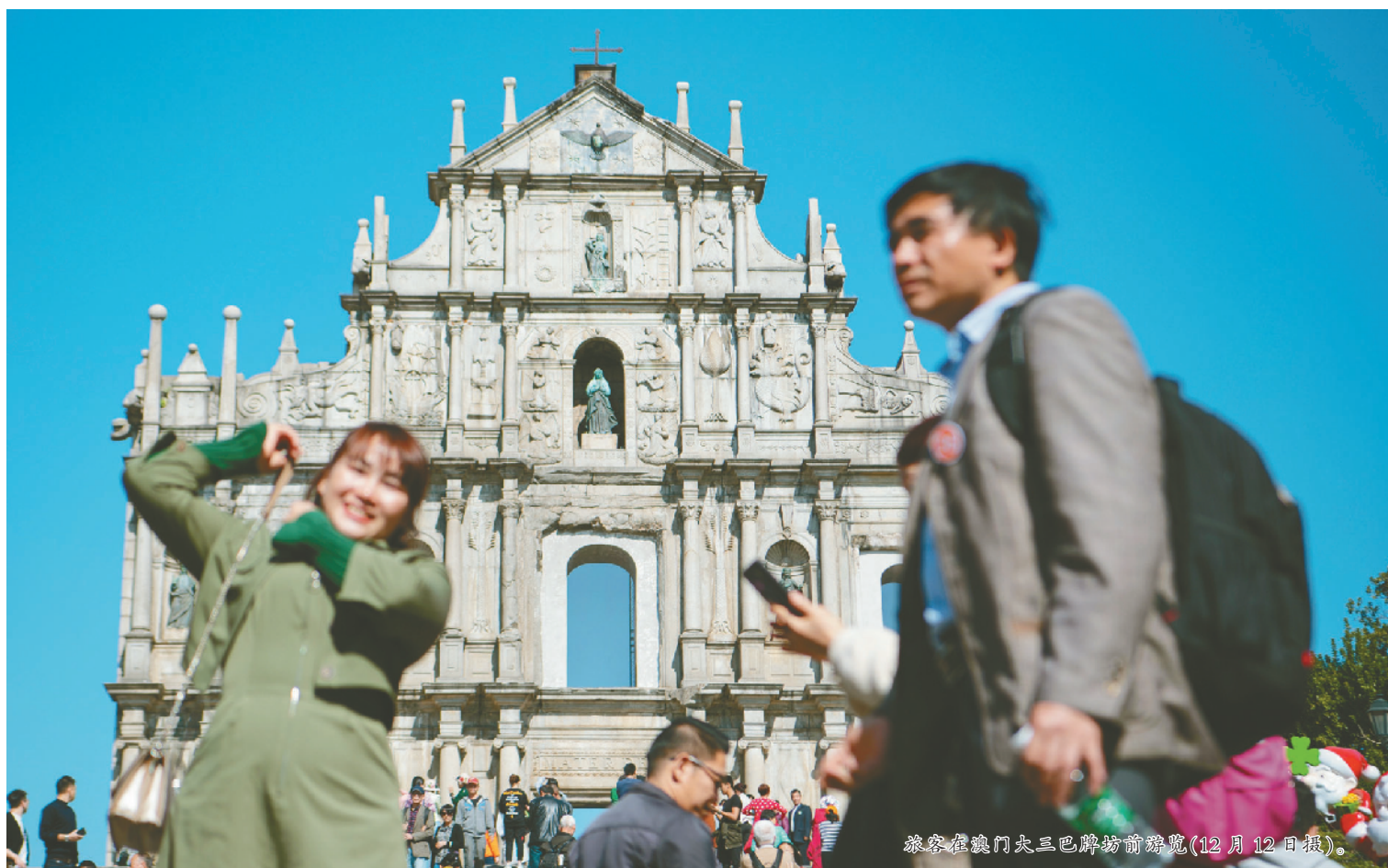
旅客在澳门大三巴牌坊前游玩(12月12日摄)。

回归20年来,澳门缔造了发展奇迹,离不开祖国内地的大力支持。同时,澳门也发挥了“一国两制”之下特别行政区的优势,以自己特有的方式融入国家发展大局,与内地共享发展机遇。