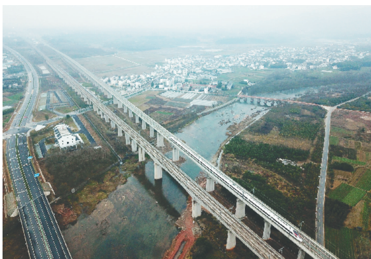
一列杭黄高铁列车驶向安徽黄山北站(2018年12月25日无人机拍摄)。