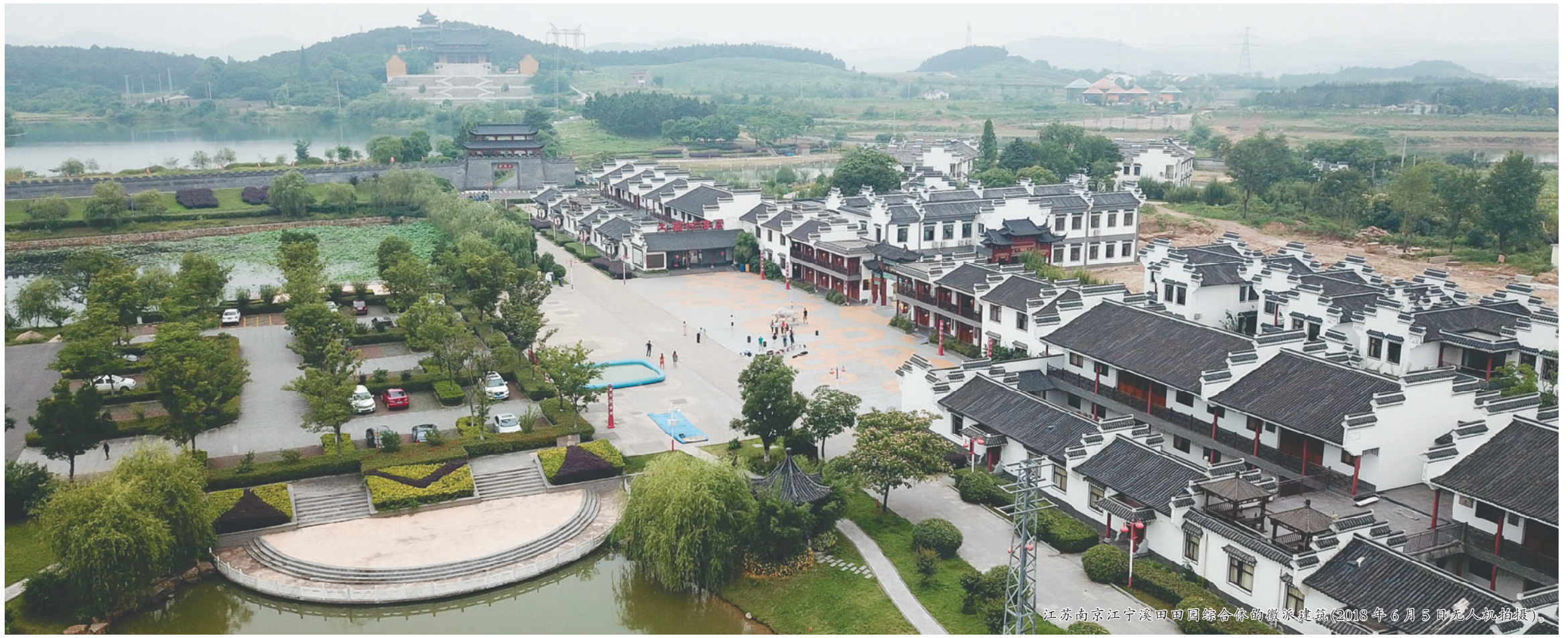
江苏南京江宁溪田田园综合体休闲度假建筑(2018年6月5日无人机拍摄)