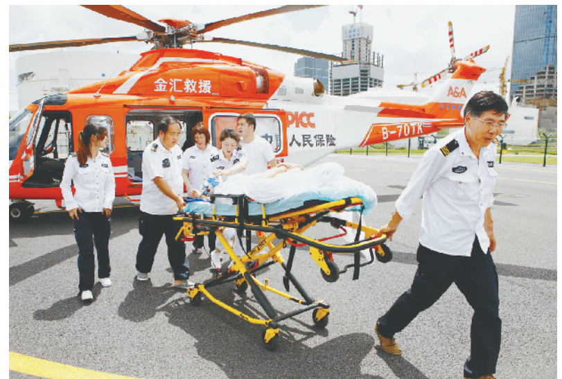
8月27日,上海120急救人员与同机抵达的泰兴市人民医院医护人员一起将病患转运至救护车,前往上海瑞金医院接受进一步抢救治疗。