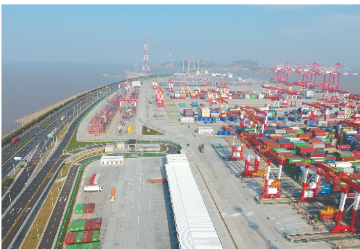
2018年7月25日无人机拍摄的上海洋山深水港四期自动化码头。

“以一体化发展释放民生红利,用实实在在的获得感、幸福感和安全感铺陈温暖底色,这是高质量发展最深刻的内涵。”陈雯说。