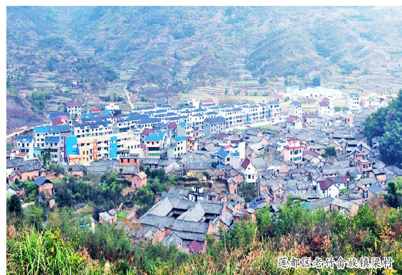
莲都区堰头村古民居风貌提升

激发内生经济活力。 以传统村落为底本，以优良生态环境为支撑，以乡土民俗风情文化为依托，以摄影写生等艺术创作为媒介，做好“传统村落+文章”，推动村落业态融合发展。“传统村落+农业”——立足“一乡一品”“一村一特”精品农业线路，抓好原种农业、自然农法基地建设，推进原种农业基地建设。“传统村落+旅游”——精准定位艺术创作、休闲度假、运动健身、养生养老等小众细分市场，大力推进特色旅游基地建设，建成一批“民宿村”“画家村”“摄影村”“户外运动休闲村”。“传统村落+文化”——创建“乡乡有节会、月月有活动”的民俗节庆展演机制，深入挖掘当地文化资源价值。