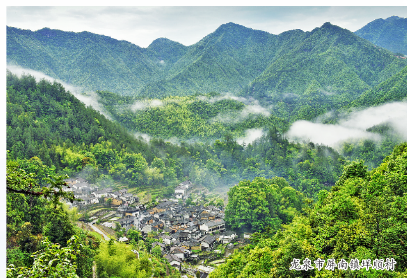
龙泉市原舍镇原塘村

莲都区已有 13 个村被列入中国传统村落名录。自启动传统村落保护工作以来，该区把传统村落保护利用规划的编制与执行作为保护工作的切入点，根据实际情况划定核心保护区和建设控制地带，因地制宜制定相应的建设控制条件。尽可能维护村落整体风貌，传承原始建筑特色。对于继续修缮又缺乏资金的历史建筑，采取可拆除的临时支护，方便将来获得资金支持后更全面地进行修复保护。同时，积极投入资金，完善基础设施建设，为村庄发展夯实基础。