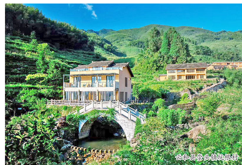
云和县黄村岭民宿群

青田县已有 4 个村庄列入中国传统村落名录。自启动传统村落保护工作以来，该县根据实际情况有针对性地提出因地制宜、以人为本、可操作性强的差异化保护措施和发展模式，划定重点保护区和风貌协调区，制定相应的建设控制条件。坚持保护第一，合理发挥传统村落的经济价值、社会价值和文化价值，如对于继续修缮又缺乏资金的历史建筑，采取民间投资，共同开发利用，带动观光、旅游、民宿等产业发展，努力恢复村落生气，做好保护和发展利用同步推进文章。