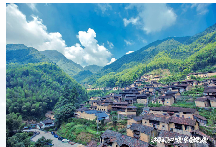
松阳县中塘乡大坑村

遂昌县共有 51 个村被列入国家级传统村落名录，其中 24 个村为省级传统村落名录。传统村落是中国农耕文明的精髓，乡土中国的“活化石”，也是人们现代乡愁的有效“消纳地”。近年来，该县以全面深入实施乡村振兴战略为需求导向，紧扣遂松乡村振兴聚落区的大定位，立足遂昌独特的山水神韵、丰富的人文蕴藏及丰富的乡村资源，形成了各个类型的乡村特色，打造了“健康、快乐、休闲”的乡村生活方式，为遂昌全域旅游发展奠定基础。