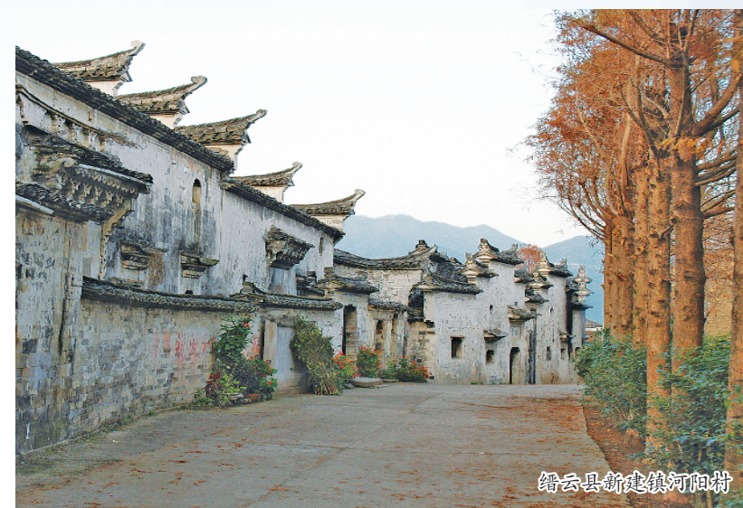
景宁县坑根村河阳村

庆元县目前有传统村落 20 个，其中国家级传统村落 15 个，省级传统村落 5 个。庆元本地保留着浓郁的地方民俗特征及传统民间艺术与各项活动等众多非物质文化遗产，例如香菇砍花法、二都戏，拥有方言中“活化石”之称的庆元方言、木拱廊桥营造技艺等。通过传统建筑的修缮保护，建立档案和数据库等措施，恢复与非物质文化遗产相关的部分历史建筑 and 基础设施的传统功能和空间形式，系统化保护文化遗产，同时，积极动员、吸纳社会各界参与申报宣传工作，形成全民参与、共建共享的宣传氛围。