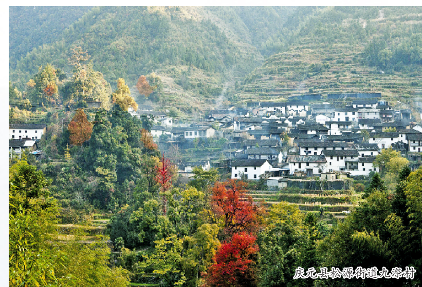
庆元县松源镇塘心畲村

云和县共有 12 个村被列入中国传统村落名录，其中 9 个村为中国传统村落，3 个村为省级传统村落，资源优势独特且丰富。近年来，云和着力培育特色生态农业，以打造绿色食品品牌为龙头，推动当地传统农业实现转型升级，比如粟溪、坑根等依托梯田 4A 景区，充分发挥自身生态优势，创建生态食品，以梯田米代表，有效增加当地居民的经济收入；擦亮“乡愁”招牌，积极发展乡村旅游度假养生休闲产业，做强乡村休闲度假、现代休闲农业等品牌产品，带动乡村旅游资源融合式开发。