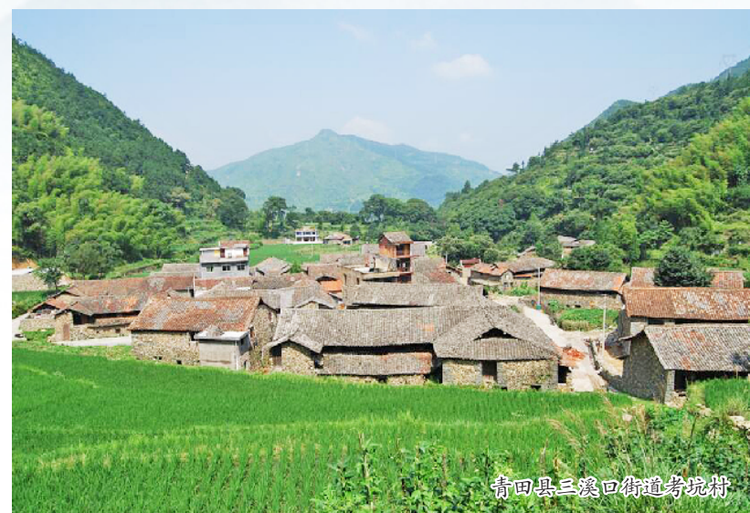
青田县巨坑乡竹垟村

龙泉市共有 49 个村庄列入中国传统村落名录，22 个村庄列入浙江省省级传统村落。在保护发展规划的编制阶段就提出采取差异化的保护措施和发展模式，同时根据龙泉传统村落分布情况，结合当地自然资源优势，选取区块串点成线。坚持保护第一，又合理发挥传统村落的经济价值、社会价值和文化价值，结合本土特色，依托丰富的原生态村落资源和深厚的农耕文化底蘊，力求彰显特色。