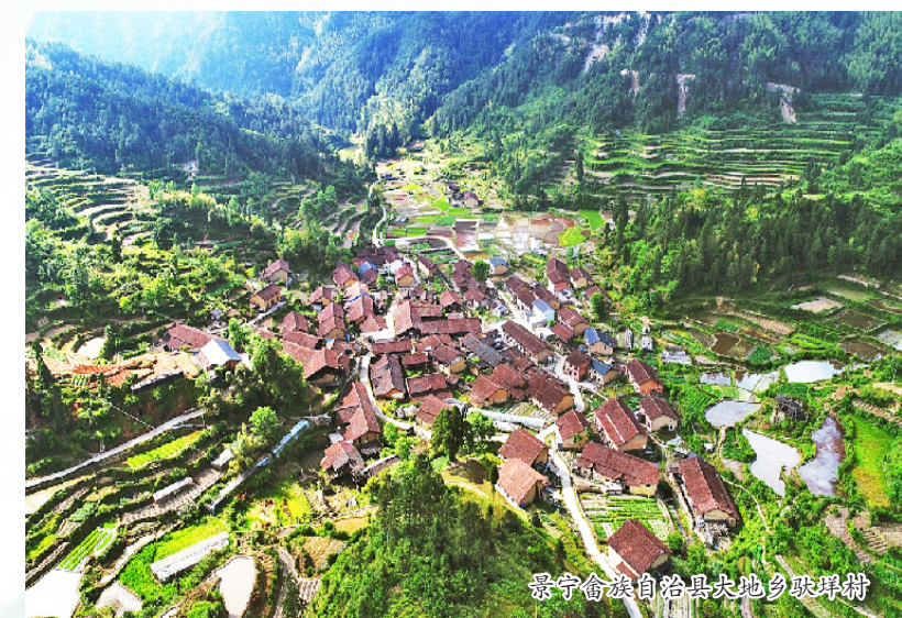
景宁畲族自治县坑根村河阳村

松阳县共有中国传统村落 75 个，总量位居全国第五，是华东地区传统村落数量最多，风格最丰富、保存最完好的县城，被誉为“最后的江南秘境”，留存完整的“古典中国”县城标本。近年来，松阳县坚持适度有序、深度融合、提升品质的原则，深入实施传统村落保护发展工程，大力实施“传统村落+特色民宿”“传统村落+生态精品农业”“传统村落+摄影写生”“传统村落+民俗文化”“传统村落+电商文创”等融合产业，推动全县传统村落得到有效保护，乡村经济得到有效激活，乡村文明得到有效传承。