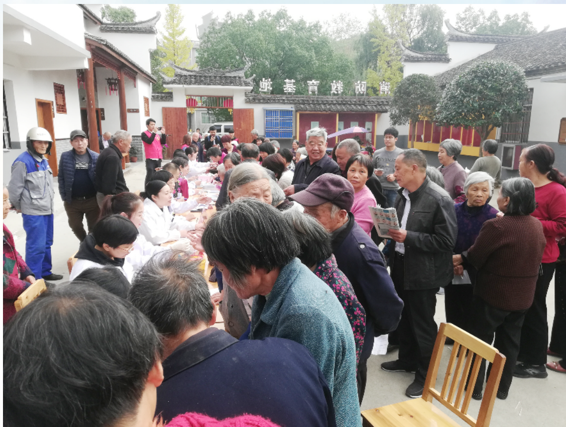
图为“健康大篷车”大型义诊暨丽水帮帮团公益联盟企业行缙云县河阳村义诊现场。