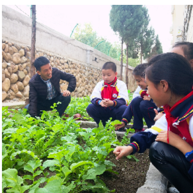
高湖镇小学“乐尚农场”蔬菜丰收在望。

进入新时代后,青田人民对教育的渴求已经从“有学上”转向“上好学”,未来的教育更加注重高质量均衡发展。奋进在教育基本现代化征程上的青田县,将着力实施基础设施建设、教育质量提高、优质均衡发展、教师队伍提升和管理体制改革等“五大工程”,在争取早日创成省教育基本现代化县的基础上,让侨乡人民享受到更加公平优质的教育。