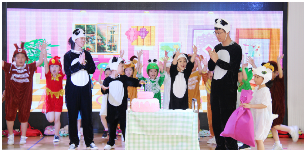
县中心幼儿园:亲子绘本剧表演。

专门出台教育人才柔性引才政策,县财政专门列支300万元,支持20个学科进行柔性引才。