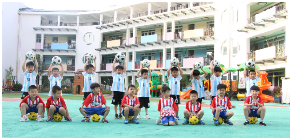
东源镇中心幼儿园:新希望足球队。

优秀人才引进难,一直以来是青田各学校普遍存在的问题。过去,尽管青田为教育领域招才引才提供不菲的待遇,然而全职引进优秀人才仍然殊为不易。对此,青田