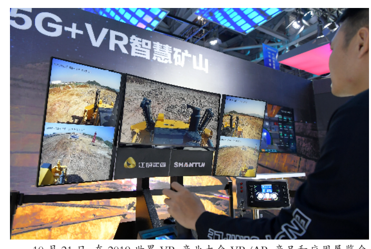
10月21日,在2019世界VR产业大会VR/AR产品和应用展览会上,工作人员为观众演示一款智慧采矿车的操作。2019世界VR产业大会10月19日至21日在江西省南昌市举行,此次大会以“VR让世界更精彩——VR+5G开启感知新时代”为主题,在VR/AR产品和应用展览会上,大批基于“VR+5G”技术的应用成果为观众带来了全新的体验。

完善制度体系和政策环境,进一步发展壮大科技特派员队伍,把创新的动能扩散到田间地头。会议对92名科技特派员和43家组织实施单位进行了通报表扬。浙江省、福建省南平市、江西省井冈山市和科技特派员代表在会上作交流发言。有关部门负责同志,各省区市和计划单列市、新疆生产建设兵团有关负责同志,部分通报表扬的科技特派员和组织实施单位代表等参加会议。