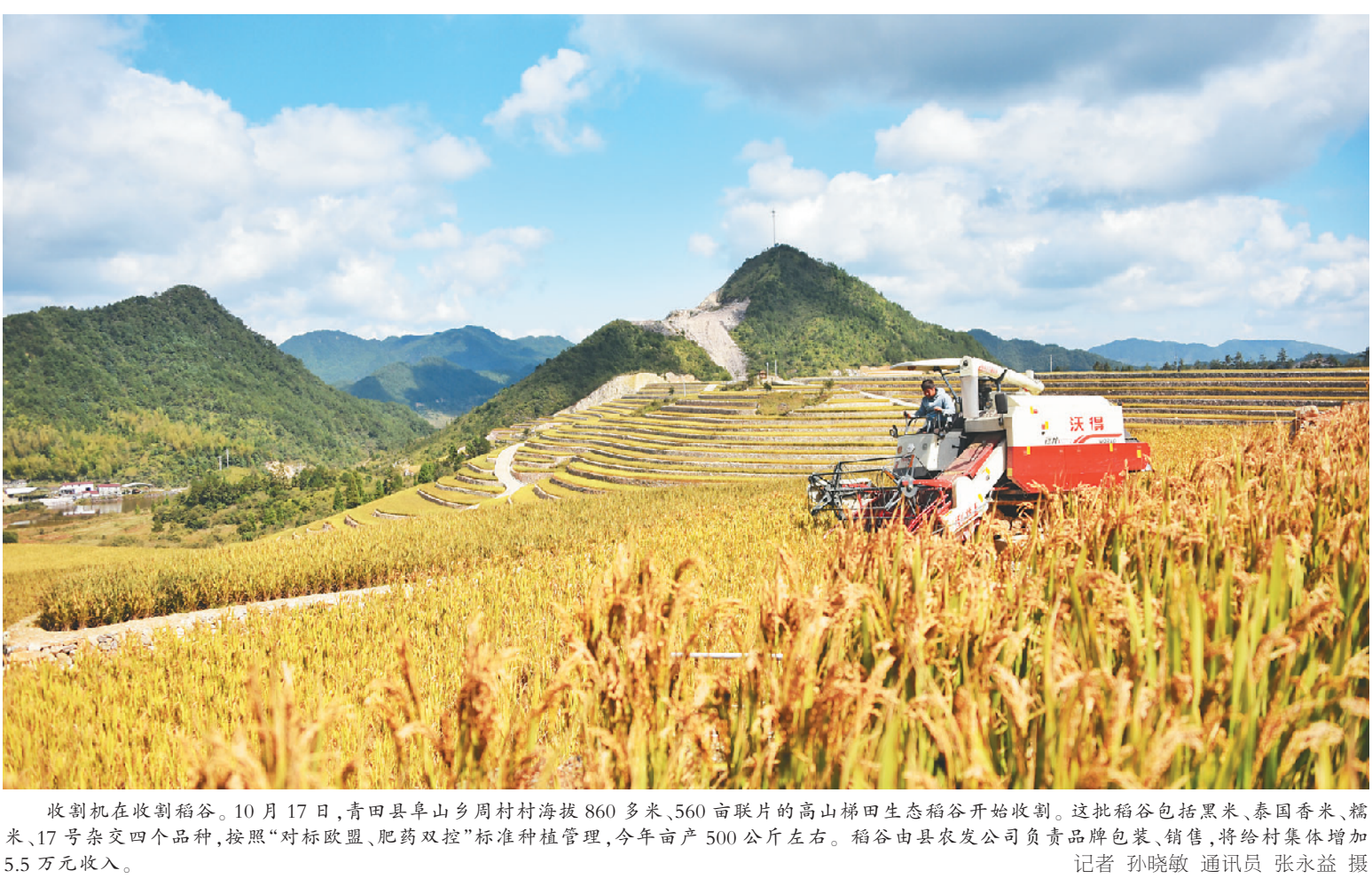
收割机在收割稻谷。10月17日,青田县阜山乡周村村海拔860多米、560亩联片的高山梯田生态稻谷开始收割。这批稻谷包括黑米、泰国香米、糯米、17号杂交四个品种,按照“对标欧盟、肥药双控”标准种植管理,今年亩产500公斤左右。稻谷由县农发公司负责品牌包装、销售,将给村集体增加5.5万元收入。